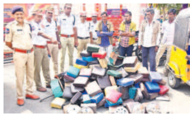
తొలగించిన ఆటోల సీట్లను చూపుతున్న పోలీసులు