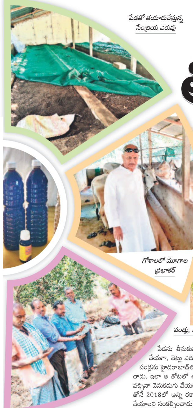
వేడతో తయారుచేస్తున్న సింధ్రియ ఎరువు