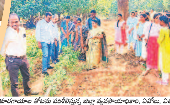
పండ్లు, కూరగాయల తోటలను పరిశీలిస్తున్న జిల్లా వ్యవసాయాధికారి, ఏవోఓ, ఏఈవోలు