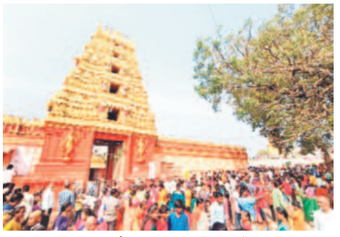
అంజన్య ఆలయం ఎదుట భక్తులు