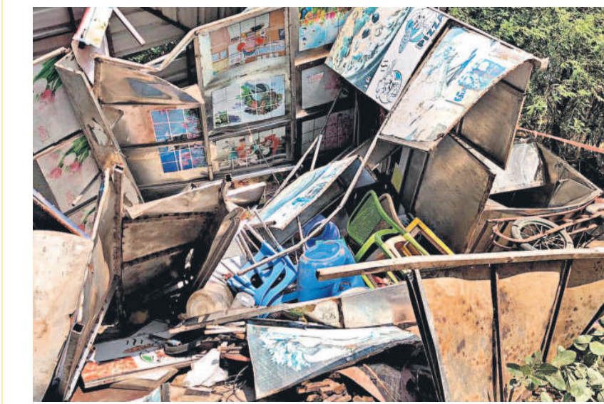
చిరు వ్యాపారాలను తొలగించిన బల్లియా సిబ్బంది

నగరంలో ట్రాఫిక్ సమస్య తీవ్రం కావడంతో పాటు పరిష్కారం కాకపోవడానికి చలు ప్రధాన కారణాలు ఉన్నాయనే వ్యాఖ్యలు వినిపిస్తున్నాయి. ఇందులో ప్రధానంగా విజయల్ పాలీసింగ్ అనేది చాలా భారీ పోలీసింగ్ అనేది చాలా తగ్గదనే అభిప్రాయాలు వ్యక్తమవుతున్నాయి. పీక్ అవర్స్ లో కొన్నిరోజుల కనిపించినా... ఆ తర్వాత లోకపోవడంతో సాధారణ సమయాల్లోనూ ట్రాఫిక్ ఇబ్బందులు తలెత్తుతున్నాయి. నగరంలో ప్రధానంగా కొన్ని చోట్ల ట్రాఫిక్ జామ్స్ తీవ్రమై... దాని ప్రభావం వినిపిస్తున్నది. దీనిపై సులభంగా పోలీసు ఆధికారుల పోలీసు అండ్ రేవంత్ విమర్శలు ఉన్నాయి. తొలుత స్వల్పకాలిక పరిష్కారాలపై దృష్టిసారించి... ఆ తర్వాత దీర్ఘకాలిక చర్యలపై వాహనదారులకు కొంతమేర ఉపశాంతి కలుగుతుందని చలువురు సూచిస్తున్నారు.