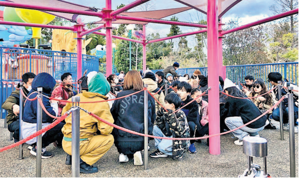
వరుస భూకంపాలు సంభవించడంతో జపాన్ లో ఓ చోట గుమికూడి తలదాచుకున్న స్థానికులు

పలు చోట్ల తీరాలను తాకిన సునామీ అలలు • మరో వారం భూకంపం వనరులు ఉండొచ్చని హెచ్చరికలు