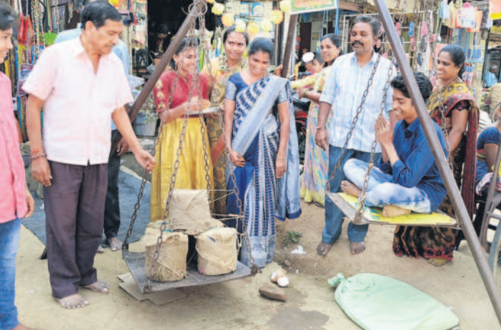
హన్మాలాలో ఎత్తుబంగారం ఇస్తున్న భక్తులు

జమీరాబాద్, జనవరి 31: సంగారెడ్డి జిల్లా జమీరాబాద్ అసెంబ్లీ నియోజకవర్గంలో వివిధ శాఖల్లో అధికారుల బదిలీలకు రంగం సిద్ధమైంది తెలిసింది. కీలకమైన పోలీసు, రెవెన్యూ, పంచాయతీరాజ్, రవాణా శాఖల్లో బదిలీలు చేసేందుకు ప్రయత్నాలు చేస్తున్నట్లు తెలిసింది. జిల్లాకు చెందిన మంత్రి బదిలీలకు సంబంధించిన నివేదికను ఇచ్చినట్లు సమాచారం. ఎన్డెయ్, తహసీల్దార్లు, ఎంపీటీసీలు, పార్టీ నాయకులు చుట్టూ చక్కర్లు కొడుతున్నట్లు చిన్న నీటిపారుదల శాఖ, గ్రామీణ నీటి సరఫరా శాఖ, వ్యవసాయశాఖ, సర్కారు దమాఖా సర్వే వైద్యకార్యాల బదిలీలపై కసరత్తు చేస్తున్నట్లు సమాచారం. మండల స్థాయి అధికారులు, సిబ్బందిని కొంతమందిని బదిలీ చేయాలని మండల స్థాయి అధికారుల బదిలీలకు కొరవడి ఉన్నట్లు తెలుస్తూనే ఉంది. పోలీసులు ప్రయత్నాలు చేస్తున్నట్లు తెలిసింది.