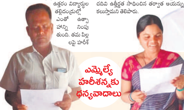
ఎమ్మెల్యే హరిశ్ రావుకు ధన్యవాదాలు

రావు మాసిస్తున్న శ్రద్ధకు వారు ముగ్ధులవుతున్నారు. ఒక గురువులా, ఒక తండ్రిలా, ఒక అన్నలా, ఒక కొడుకులా తమకు మనోధైర్యాన్ని కల్పిస్తున్నారని సంతోషం వ్యక్తం చేస్తున్నారు. మా పిల్లలకు మంచి భవిష్యత్తుకు పునాది వేస్తూ.. ఉత్తమ ఫలితాలు సాధించేందుకు ఆత్మవిశ్వాసాన్ని నింపారని తల్లిదండ్రులు అభిప్రాయం వ్యక్తం చేస్తున్నారు. మాజీ మంత్రి హరిశ్ రావు రాసిన ఉత్తరం విద్యార్థుల తల్లిదండ్రుల్లో ఎంతో ఉత్సాహాన్ని నింపుతున్న ఉత్తరం మాజీ మంత్రి, ఎమ్మెల్యే హరిశ్ రావు రాసిన ఉత్తరం విద్యార్థుల తల్లిదండ్రుల్లో ఎంతో ఉత్సాహాన్ని నింపుతున్న ఉత్తరం మాజీ మంత్రి, ఎమ్మెల్యే హరిశ్ రావు రాసిన ఉత్తరం విద్యార్థుల తల్లిదండ్రుల్లో ఎంతో ఉత్సాహాన్ని నింపుతున్న ఉత్తరం