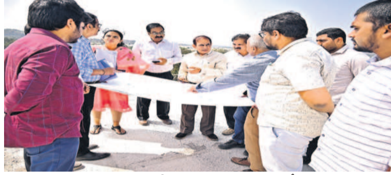
అధికారులను వివాలన లడిగి తెలుసుకుంటున్న జలమండలి ఎంపీ సందర్శన రివ్యూ