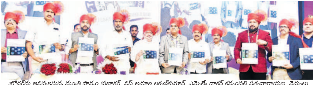
లోపలన అవిద్యులస్తున్న మంత్రి పొన్నం ప్రభాకర్, వీవీ అడ్డూరి లక్ష్మణకుమార్, ఎమ్మెల్యే దాక్షిణి కన్యకల సత్కారాలను, వైద్యులు