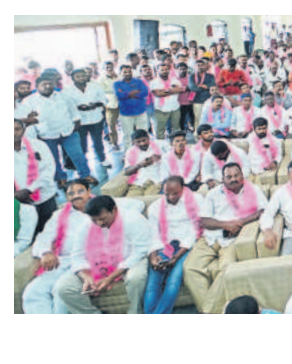
సమావేశానికి హాజరైన బీఆర్ఎస్ శ్రేణులు