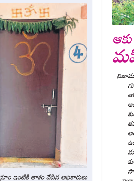
డబుల్ బెడ్రూం ఇంటికి తాళం వేసిన అధికారులు