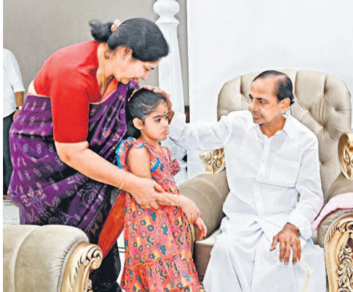
శ్రీశైలం, నాగార్జునసాగర్ ప్రాజెక్టులను కేఆర్ఎంబీకి అప్పగించడంపై పార్టీవరంగా పోరాడుదామని టీఆర్ఎస్ అధినేత కేసీఆర్ పిలుపునిచ్చారు. శనివారం కేసీఆర్ తో పలువురు సీని, రాజకీయ ప్రముఖులు ఘోషే అయ్యారు. ఈ సందర్భంగా నవ్వునతిరాధోదే మునుమాల్ని కేసీఆర్ అప్పాయింగా పిలువాలంటూ పిలుపునిచ్చారు.