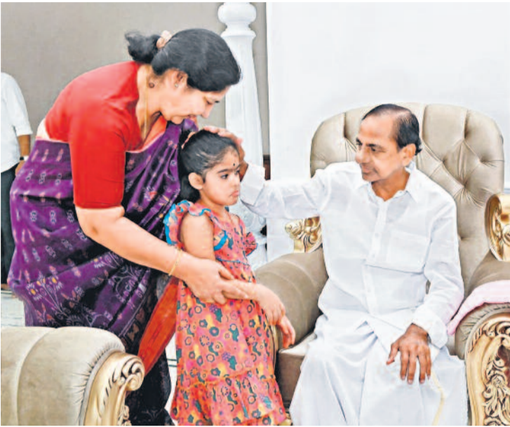
శ్రీశైలం, నాగార్జునసాగర్ ప్రాజెక్టులను కేఆర్ఎంబీకి అప్పగించడంపై పార్టీవరంగా పోరాడుదామని ఠీకడేవర్ అధినేత కేసీఆర్ పిలుపునిచ్చారు. శనివారం కేసీఆర్ తో పలువురు సీని, రాజకీయ ప్రముఖులు ఘోషే అయ్యారు. ఈ సందర్భంగా నవ్వునతిరాధోదే మునుమరాలిని కేసీఆర్ అప్పగించామని పిలుపునిచ్చారు.