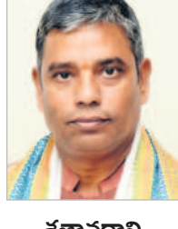
శతావధాని అమృతాల మురళి

అలా కాకుండా మేము ఆశపూర్వకం 50 చెప్పాం. ఆ మిగిలినటువంటివి 12:12 చెప్పాం' అనడానికి మీర్లేదు. అవధానం వికాసం దేశీయ వచ్చేటప్పటికి ఒక స్పష్టత ఏర్పడింది. కవిత్వంగా ఈ అంశాలు ఉండాలి అని! ఆ స్పష్టత వల్ల తర్వాతి తరం అవధానాలు హాయిగా అవధానాలు చేసే కుంటూ వెళ్లడానికి కావలసిన సిద్ధాంతం సమకాలింది. మనం పద్యాన్ని నిలుబెట్టుకోవడానికి, తద్వారా మనం సంరక్షించుకోవడానికి ఒక ఆకరంగా అవధానం ఏర్పడింది. తద్వారా పద్యం తర్వాతి తరానికి కూడా అందుతుంది. ఛదీ పుస్తక తరాల వరకు భాష బతుకుతుంది.