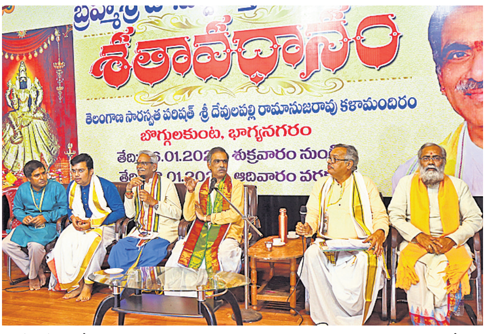
తెలంగాణ సాహిత్య పరిషత్ శ్రీ దేవులపల్లి రామానుజరావు కళామందిరం హౌస్ ఫుల్లకుంట్ల, భాగ్యనగరం. తేదీ: 01.01.2024 శుక్రవారం సమయం: 10.00 గంటల నుండి 12.00 గంటల వరకు. ఆదివారం వరకు.

జమీందార్ల వద్ద ఉండే పండితులు, ఆ పండిత సభల్లో చెప్పే కవిత్వం కేవలం కాలక్షేపానికి చెందిన అంశంగా మారిపోయింది. కాలక్షేపం అన్నప్పుడు, ఆస్తికర్తలు జమీందారులను మెల్లమెల్లగా సమస్యాపూరితం చేశారు. అంటే మొదలయ్యాయి సంస్కానాల్లో. జమీందారుల యాగంలో ఆకలికత్తం వల్ల, అవధానం వల్ల, కవుల దేశాటనం వల్ల, తెలుగు కవిత్వంలో ఒక రెవల్యూషన్ వంటి ఏకక మొదలైంది దీని గురించి ఆరుద్ర చెప్పారు.