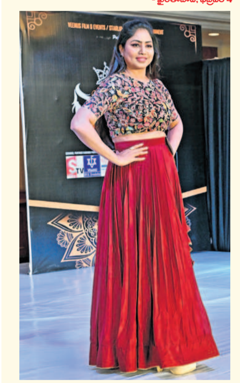
- బిరతాబాద్, ఫిబ్రవరి 4

మిసెస్ అండ్ మిస్ మెరుపులు అందమైన భామలు ర్యాంప్ వాక్ చేస్తూ హాసం చేశారు. ఆదివారం రాత్రి వీసీ ఫిట్స్ అండ్ ఈవెంట్స్, స్టార్ లైట్ ఈవెంట్ అండ్ ఎంటర్టైన్మెంట్ అధ్యక్షులతో సామాజిగూడలోని కల్పితా హాటెల్లో మిస్, మిసెస్ సాత్ ఇండియా ఫ్యాషన్ పోటీలను నిర్వహించారు. ఈ సందర్భంగా పలువురు మోడల్స్ ర్యాంప్ వాక్ చేసి ఆకట్టుకున్నారు.