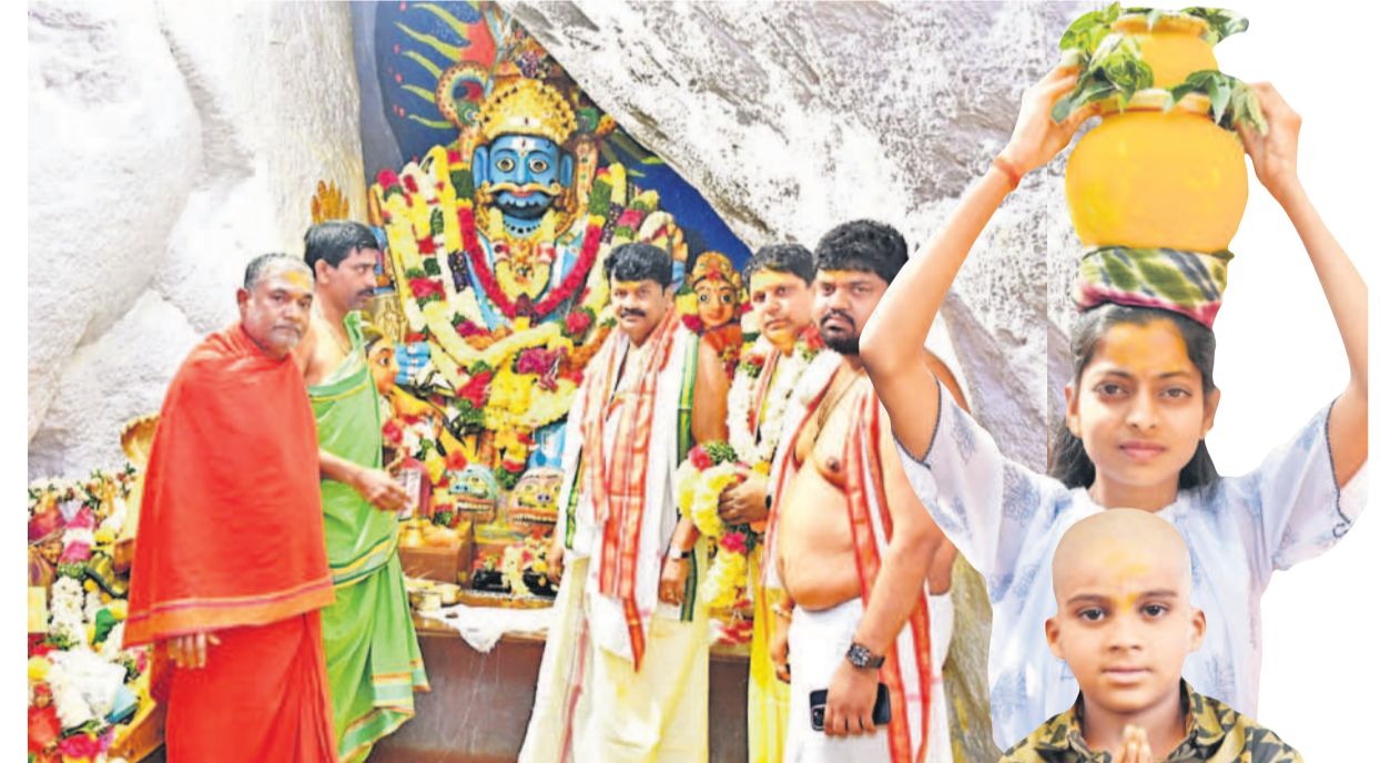
మల్లన్న, సన్నిధిలో మాజీ మంత్రి తలసాని శ్రీనివాసయ్యాదవ్