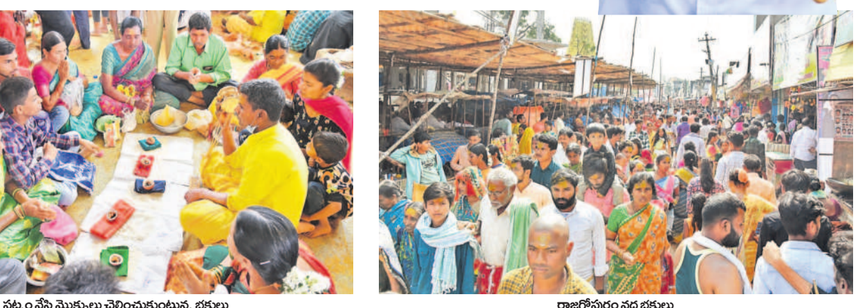
పటం మొక్కులు చెల్లించుకుంటున్న భక్తులు