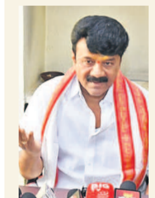
సిద్దిపేట జిల్లా కొమరవెల్లిలో మాట్లాడుతున్న మాజీ మంత్రి తలసాని శ్రీనివాసయ్యాదవ్

మాజీ మంత్రి, సనత్ నగర్ ఎమ్మెల్యే శ్రీనివాసయ్యాదవ్