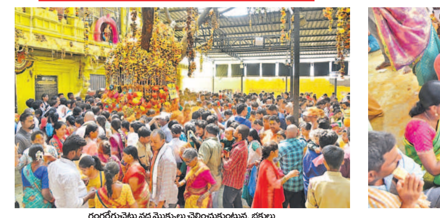
గంగనేరెవెల్లి మల్ల మొక్కులు చెల్లించుకుంటున్న భక్తులు