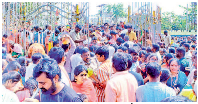
అమ్మవార్ల గడ్డల వద్ద భక్తజన సందోహం