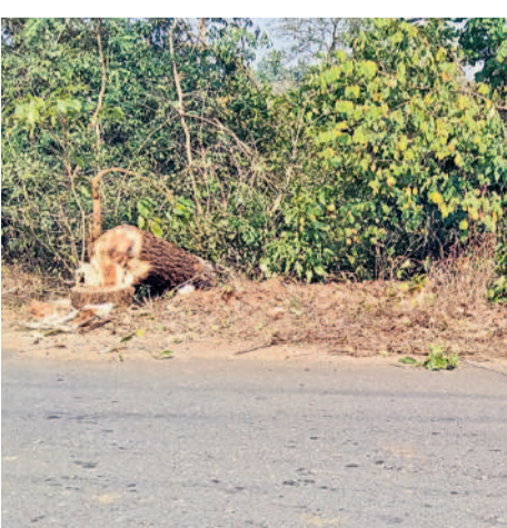
కమలాపూర్-రాంపూర్ మధ్య రోడ్డు వెంట నరికివేసిన చెట్లు

జయశంకర్ భూపాలపల్లి, ఫిబ్రవరి 4 (నమస్తే తెలంగాణ) : మేడారం దారిలో చెట్లు నేలకొరకుతున్నాయి. మొయిటిస్ న్స్ లో భాగంగా చేస్తున్న జంగిల్ కటింగ్ పేరుతో భారీ వృక్షాలను నరికేస్తున్నారు. మేడారం సమృద్ధిగా సారలమ్మ మహాజాతర సమీప స్పందడంతో జిల్లాలోని భూపాలపల్లి మండలం కమలాపూర్ రోడ్డు, కాటారం రోడ్డు పాడవుతూ మేడారం వరకు రోడ్డుకు ఇరువైపులా ఆర్ అండ్ బీ అధికారులు జంగిల్ కటింగ్, సైడిబర్ని, మొయిటిస్ న్స్ పనులను ప్రారంభించారు. మొత్తం 75 కిలోమీటర్ల పాడవుతూ రూ. 15 లక్షలతో చేపట్టిన ఈ పనుల్లో చెట్లను తొలగిస్తున్నారు. కాటారం రోడ్డు పాడవుతూ మేడారం వరకు 50 కిలోమీటర్ల కమలాపూర్ రోడ్డు పాడవుతూ 25 కిలోమీటర్ల జంగిల్ కటింగ్ పనులు కొనసాగుతున్నాయి. రోడ్డుకు ఇరువైపులా చదును చేయడం, అవసరమైన చోట సైడిబర్ని పోయడం, వాహనాలకు అడ్డ వచ్చే చెట్ల కొమ్మలను కట్టే చేయిస్తున్నారు. అయితే చెట్లను మాత్రం తొలగించొద్దు. కానీ మండలంలోని కమలాపూర్, రాంపూర్ గ్రామాల మధ్య జంగిల్ కటింగ్ లో భాగంగా యెట్ల చూగ చెట్లను నరికేస్తున్నారు. ఈ రోడ్డు