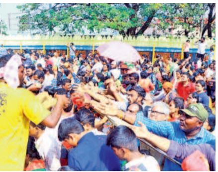
బంగారం కోసం పోటీపడుతున్న భక్తులు