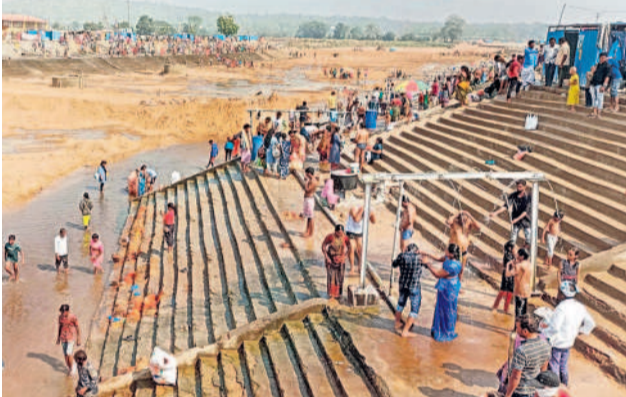
జంపన్న వాగులో స్నానాలలోనిస్తున్న భక్తులు