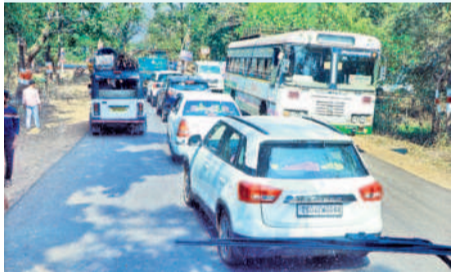
మేడారం దారిలో వాహనాల రద్దీ