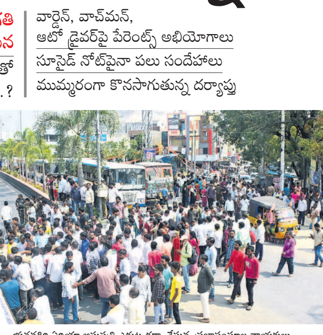
భువనగిరి విలయా ఆసుపత్రి ఎదుట ధర్మా చేస్తున్న ప్రజాసంఘాల నాయకులు, విద్యార్థుల కుటుంబ సభ్యులు

అంతుబట్టిన పదో తరగతి విద్యార్థుల ఘటన స్కూల్ లో బాలికలతో గొడవే కారణమా..?