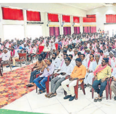
సమావేశానికి హాజరైన బీఆర్ఎస్ శ్రేణులు

బతుకులను ప్రకారంగా చేస్తున్న కేఆర్ఎం బీ నిరసనూ రైతాంగం ఉద్యమించా నేతలు లంకెల బందిల కోసం వేత కాని పాలనకు నిద్రపోవడం, డాంగల్ లంకెల బందిల కోసం వెతుకుతారని ఎద్దేవా చేశారు. తెలంగాణ ప్రజలు చైతన్యవంతలు అని, నిర్వీర్యంగా సాగుతున్న కాంగ్రెస్ పాలనను ఆగ్రహించుకుంటున్నారన్నారు. రామన్నపార్లమెంట్ ఎన్నికల్లో బీఆర్ఎస్ ని బారి మెకానిక్ గా గెలిపించటం ఖాయమని ఆంధ్ర, తెలంగాణ రాష్ట్రాల మౌన వ్యతిరేకతలు సూచించిన ఘటనలు గుర్తుచేశారు.