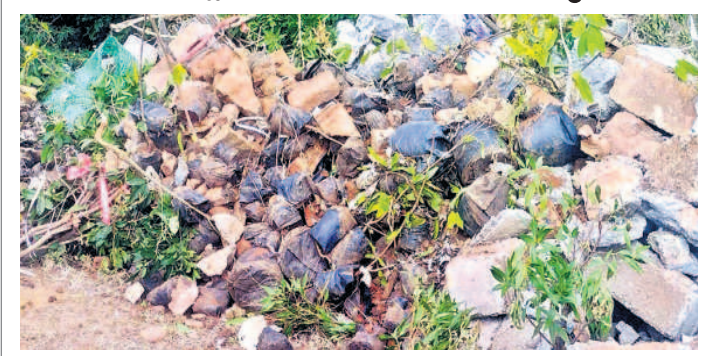
హిల్కాలనీలోని సెయింట్ జోసఫ్ పాఠశాల పక్యన ఉన్న చెత్త కుష్పలో పడేసిన హరితహారం మొక్కలు

ప్రభుత్వం హరితహారం కార్యక్రమాన్ని ప్రతి ష్ఠాత్మకంగా చేపట్టింది. మొక్కలు పెంచి పచ్చ దనాన్ని పెంచింది. కానీ ఇప్పుడు ఆ పరిస్థితి కనిపించడం లేదని నిర్లక్ష్యంగా వ్యవహరిస్తు న్నారని ప్రజలు పేర్కొంటున్నారు. నందికొండ హిల్కాలనీలోని సెయింట్ జోసఫ్ పాఠశాల సమీపంలో ఉన్న రహదారి పక్కన చెత్తకు ప్పలో హరిత హారం మొక్కలు పడేసి ఉన్నాయి. సుమారు 500లకు పైగా మొక్కలు