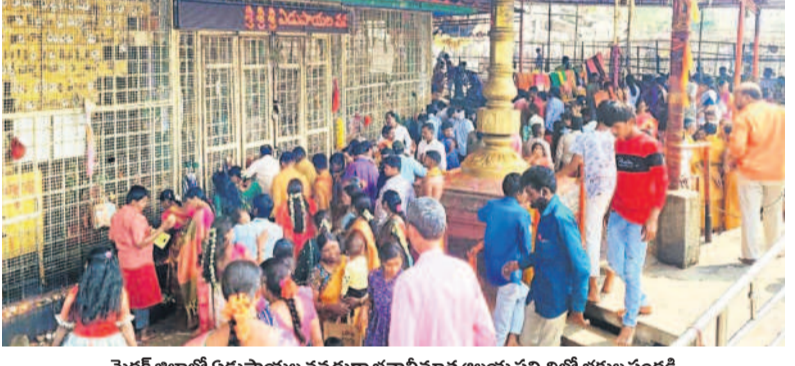
మెడక్ జిల్లాలో ఏడుపాయిల్ వనదుర్గా భవానిమాత ఆలయ సన్నిధిలో భక్తుల సందడి