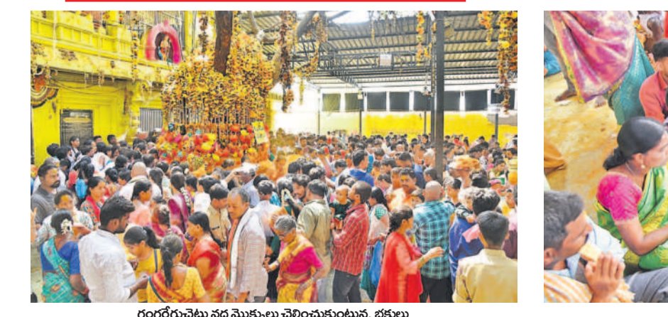
గంగనేరచెట్టు వద్ద మొక్కులు చెల్లించుకుంటున్న భక్తులు