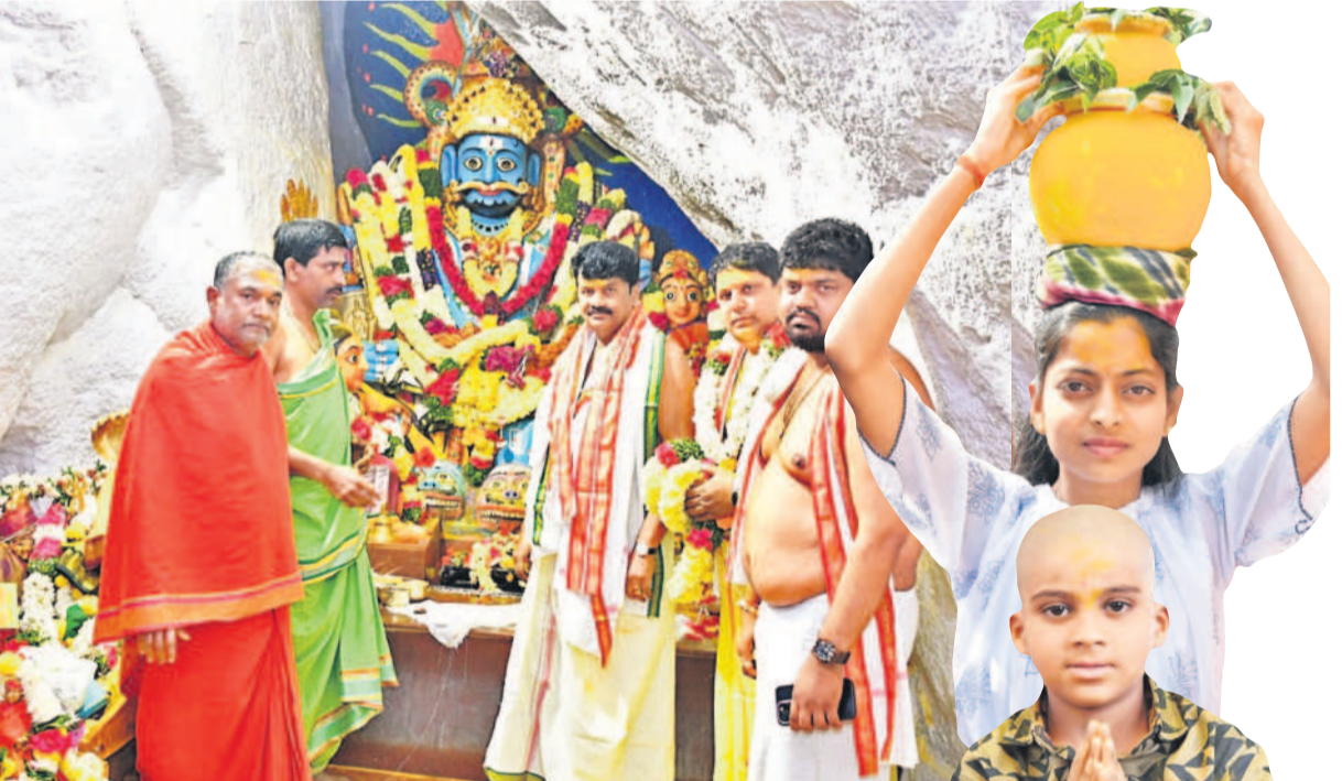
మల్లన్న సన్నిధిలో మాజీ మంత్రి తలసాని శ్రీనివాస యాదవ్