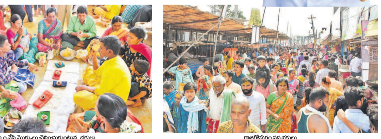
పట్నం మొక్కులు చెల్లించుకుంటున్న భక్తులు