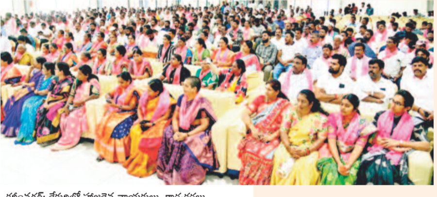
కరీంనగర్: రేకుల్లో హాజరైన నాయకులు, కార్యకర్తలు