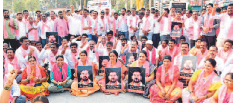
సిరిసిల్లలో దర్నా చేస్తున్న బీఆర్ఎస్ నాయకులు, కార్యకర్తలు