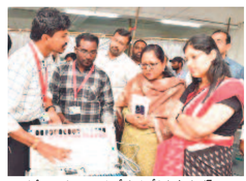
ఈవీఎం యంత్రాల పనితీరు పరిశీలిస్తున్న కలెక్టర్