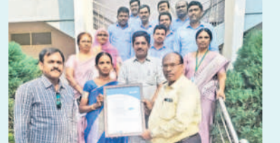
భీమదేవరపల్లి, ఫిబ్రవరి 5 : ముల్కనూరు మహిళా సహకార డెయిలీకి మూడో సారి ఐఎస్వో గుర్తింపు లభించింది.