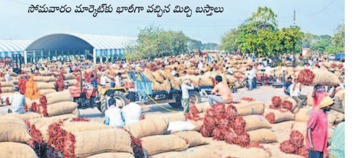
సోమవారం మార్కెట్లో భారీగా వచ్చిన మిర్చి బస్తాలు

కాజీబుగ్గ, ఫిబ్రవరి 5 : వరంగల్ ఎనుమాముల వ్యవసాయ మార్కెట్ పరిధిలోని మిర్చి యార్డుకు సోమ వారం రికార్డు స్థాయిలో 30,918 మిర్చి బస్తాలు వచ్చాయి. ఈ సీజన్ డిసెంబర్ నుంచి ప్రారంభం కాగా సోమవారం అత్యధికంగా మిర్చి బస్తాలు రావడంతో మార్కెట్లో ఎటువంటి నా ఎర్రబంగారం బస్తాలతో కకకలాడింది. సీజన్ ప్రారంభంలో నామమాత్రంగా రోజుకు రెండు వేల నుంచి 10వేల బస్తాల వరకు వచ్చేవి. సంత్రాంతం పండుగ తర్వాత మార్కెట్లో మిర్చి బస్తాల రాక పెరిగింది. జనవరి 19న అత్యధికంగా 25వేల బస్తాలు వచ్చాయి. సోమవారం 30,918 లకు పైగా మిర్చి బస్తాలు మార్కెట్లో వచ్చినట్లు అధికారులు తెలిపారు. ధరలు మాత్రం ఎలాంటి హెచ్చుతగ్గులు లేకుండా నిలకడగానే ఉంటున్నట్లు వ్యాపారులు తెలిపారు. మిర్చి రాక పెరగడంతో అడ్డీ, ఖరీదు వ్యాపారులతో పాటు దడువాయి, గుమ్మ స్టా, హమాల్, ఇతర కార్మికుల హార్డులకు వ్యక్తం చేస్తున్నారు. తమకు చేతి నిండా పని దొరుకుతుందని కార్మికులు సంబుధించుకున్నారు. ఇప్పటివరకు మార్కెట్లో లక్షా 81వేల క్వింటాళ్ల