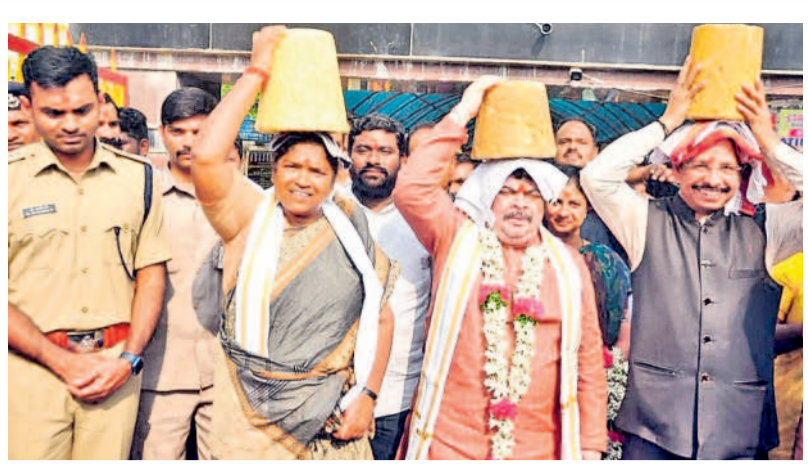
నెలనె బిల్లంతో అమ్మవార్ల దర్శనానికి వస్తున్న మంత్రులు పాస్పం, సీతక్క, అర్జీనీ ఎంపీ సజ్జనార్