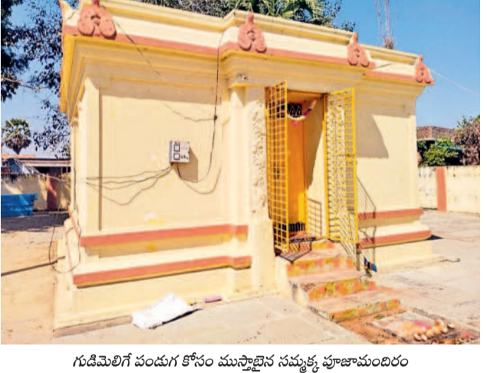
గుడిమెలిగే పండుగ కోసం ముస్తాబైన సమృద్ధి పూజామందిరం