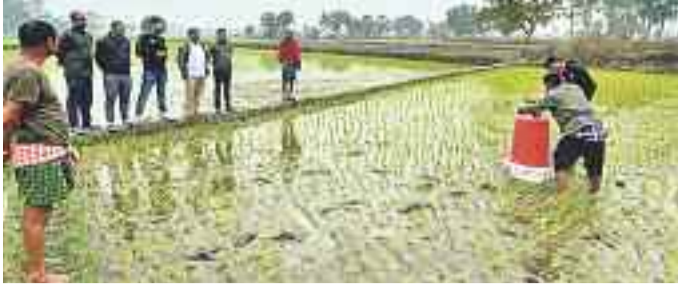
పల పాలాల్లో జీహెచ్ఐ కోలమానిని ఏర్పాటుచేస్తున్న ఇక్రికాట్ అధికారులు