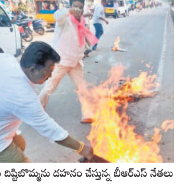
సీఎం దిష్టిబొమ్మను దహనం చేస్తున్న బీఆర్ఎస్ నేతలు