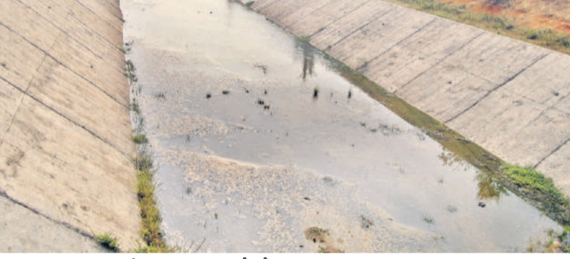
నీళ్లు పారకపోవడంతో బోసోపాయి దర్శనమిస్తున్న కాల్వ

జూరాల ప్రాజెక్టుకు ఎగువన ఉన్న కర్ణాటకలోని అల్లట్టి, నారాయణపూర్ నుంచి వరద వచ్చి చేరుతున్నది. అయితే కృష్ణా ప్రాజెక్టులను కేంద్రం జలవనరుల శాఖకు అప్పగించడంతో జూరాల ప్రాజెక్టు పరిస్థితి రెంటికి చెక్క రేవడిలా తయారైంది. ఎగువన వరదలు వచ్చినప్పుడు దిగువకు నీరు విడుదలయ్యేది. ఇక్కడికి వచ్చిన నీటిని జూరాలలో స్టోరేజీతోపాటు బ్యాక్ వాటర్ నుంచి నెట్టింపాడి ఎత్తిపోతలకు తరలించేవారు. కానీ ఇక ఆ పరిస్థితికి అవకాశం లేదు. వచ్చే ప్రతి నీటి చుక్కకు లెక్క వూరితూ ఉండడంతో నీటిల్లో హక్కును కోల్పోయే ప్రమాదం ఏర్పడింది. ఇప్పటికే జూరాల ప్రాజెక్టులో పూడి నిండి పోవడంతో ప్రస్తుతం 6 నుంచి 7 టీఎంసీల నీటిని మాత్రమే నిల్వ చేసుకొనే అవకాశం ఉన్నది. ఎగువ నుంచి నీరు రాకపోతే జూరాల ప్రాజెక్టు ఎండిపోయే ప్రమాదం ఉన్నది. ఈ డ్యాంపై ఆధారపడిన అయిదేళ్లపాటు వరద సమయంలో నికర జలాలను వినియోగించుకోనే అవకాశాన్ని కోల్పోయే ప్రమాదం ఏర్పడుతుంది. దీని పరిధిలో ఏర్పాటు చేసిన లిఫ్టుపై ఆ ప్రభావం పడే అవకాశం ఉంది. జూరాల ప్రాజెక్టు కింద కడి కాల్వ ద్వారా జోగులూరి గద్వాల జిల్లాలో 35,657 ఎకరాలకు, ఏడవ ప్రధాన కాల్వ కింద 69,084 ఎకరాల అయిదేళ్లు (వనపర్తి, నాగర్ కర్నూల్ జిల్లాలో) సాగులోకి 2005 సంవత్సరం నుంచి వచ్చింది. ప్రస్తుతం జూరాలలో నీటి లభ్యత లేని కారణంగా యాసంగి పంటలకు విరామం ఇచ్చారు.