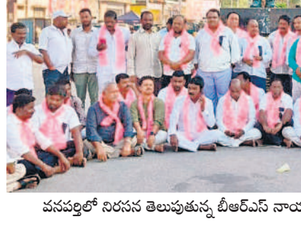
వనపర్తిలో నిరసన తెలుపుతున్న బీఆర్ఎస్ నాయకులు