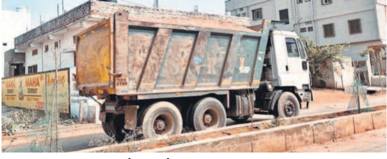
కల్వకుర్తిలో టీప్పర్లలో ఇసుకను తరలిస్తున్న వ్యాపారులు