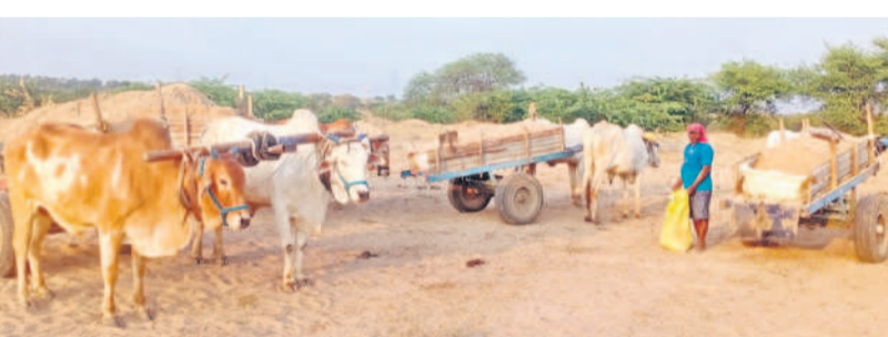
మదనాపురం మండలంలోని వాగులో ఇసుక నింపుకొంటున్నప్పటికీ, బండ్లయజ్జ మానులు