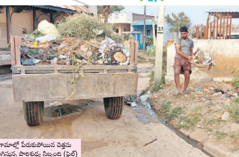
గ్రామాల్లో పేరుకుపోయిన చెత్తను తొలగిస్తున్న పారిశుధ్య సిబ్బంది (ఫైల్)

పట్టణమకునే నాడుడే లేరు. కొత్తగా ఏర్పడిన కాంగ్రెస్ ప్రభుత్వం గ్రామాల అభివృద్ధి దృష్టి సారించలేదు. ఫలితంగా బకాయిలు భారం, సిబ్బంది లేమి సమస్యలు గ్రామ పంచాయతీల నిర్వహణకు భారంగా మారాయి. కేసీఆర్ ప్రభుత్వ హయాంలో పల్లె ప్రగతి పేరిట జరిగే పారిశుధ్య వారోత్సవాల్లో సర్పంచులు, ఎంపీటీసీలు, ఎమ్మెల్యేలు, ఎంపీలు, ప్రజాప్రతినిధులు పాల్గొని పారిశుధ్య వారోత్సవం నిర్వహించారు. ఇప్పుడు ప్రజాప్రతినిధులు పాల్గొనడం సందేహంగా మారింది. స్థానికంగా కాంగ్రెస్ పక్షం లేకపోవడంతో ఎమ్మెల్యేలు వంటి ప్రజాప్రతినిధులూ భాగం లేకపోవడంతో స్పెషల్ డైరీ భారంతో అధికారులపై పడింది. మరి ఈ కార్యక్రమం ఎంత వరకు సక్సెస్ అవుతుందన్న ప్రశ్నల వ్యక్తమవుతున్నాయి. ఫలితంగా పారిశుధ్య స్థానం డైరీ ఉమ్మడి పాలమూరులోని 1,692 గ్రామ పంచాయతీల్లో ప్రత్యేక అధికారుల సవాల్ గా నిలవనున్నది.