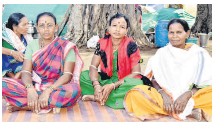
సంప్రదాయ కట్టబట్టులో మెన్టం వంశీయుల మహిళలు