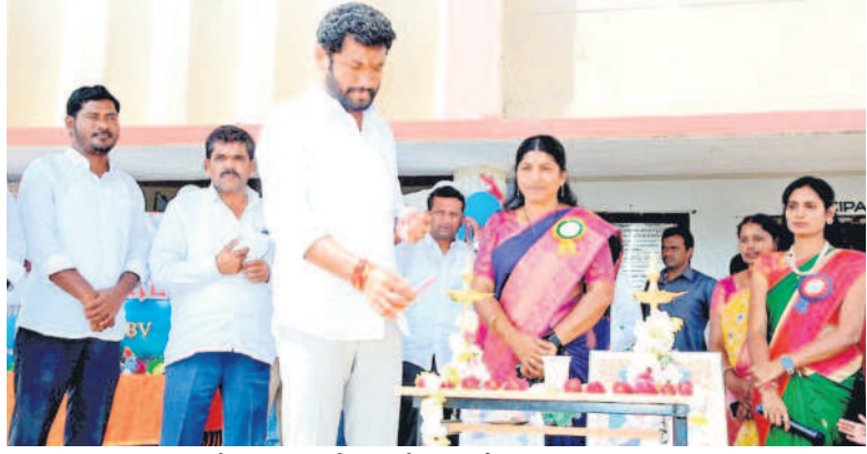
జిల్లా ప్రజలను చేస్తున్న బోధ ఎమ్మెల్యే జాడవ లాలకుమార్