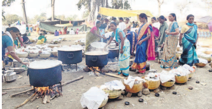
సామూహికంగా వంటలు చేస్తున్న మహిళలు