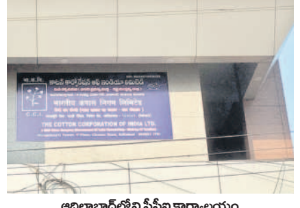
ఆదిలాబాద్లోని సీసీబి కార్యాలయం

ఆదిలాబాద్, ఫిబ్రవరి 7 (నమస్తే తెలంగాణ) : ఆదిలాబాద్ జిల్లావ్యాప్తంగా పత్తి రైతులు రోజుకు రూ.15 లక్షలను నష్టపోవాల్సిన దుస్థితి దాపురించింది. మద్దతు ధర చెల్లించి ఆదుకోవాల్సిన కేంద్ర ప్రభుత్వం రంగ సంస్థ కాలిన్ కార్పొరేషన్ ఆఫ్ ఇండియా (సీసీబి) అన్నదాతలను సట్టిట ముందుకున్నది. కేంద్ర ప్రభుత్వం ప్రకటించిన రూ.7,020 మద్దతు ధరను చెల్లించడం లేదు. నాణ్యత పీరిట క్వింటాలుకు రూ.50 తగ్గింది కొనుగోలు చేస్తున్నది. ఫలితంగా రైతులు ప్రైవేట్ వ్యాపారులకు అమ్మి భారీగా నష్టపోవాల్సి వస్తున్నది.