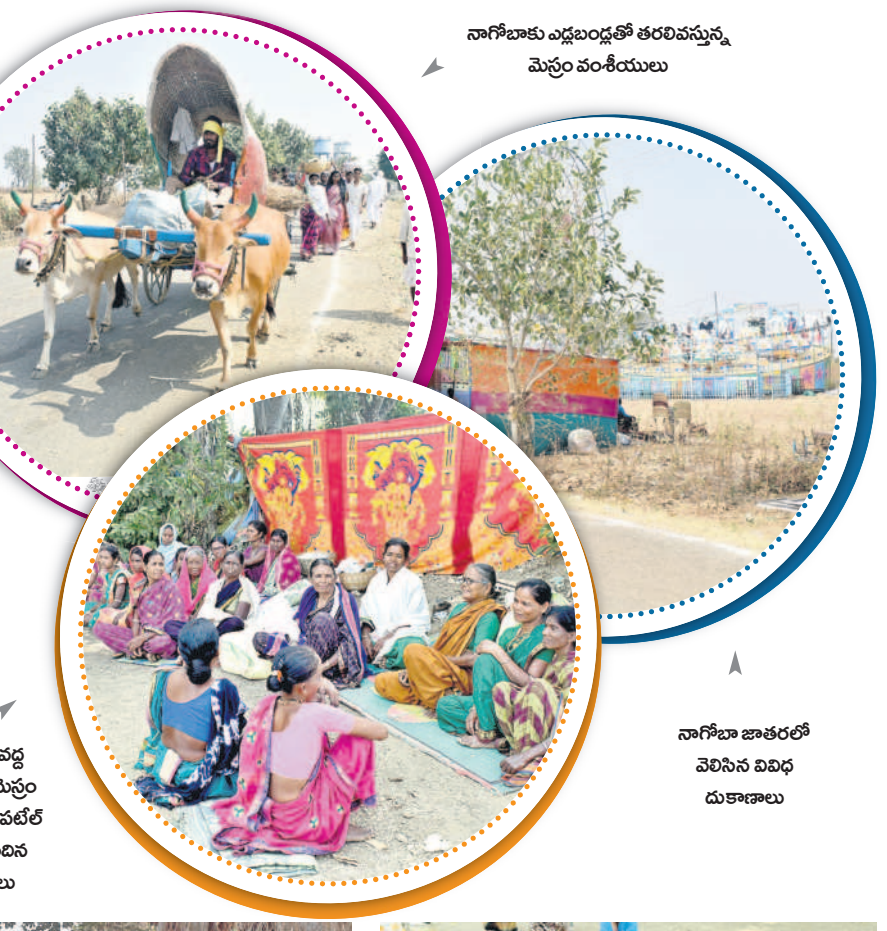
జొన్నగట్ట లద్దులను చేస్తున్న మహిళలు