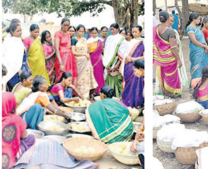
జొన్నగట్ట లద్దులను పంచుకుంటున్న మహిళలు