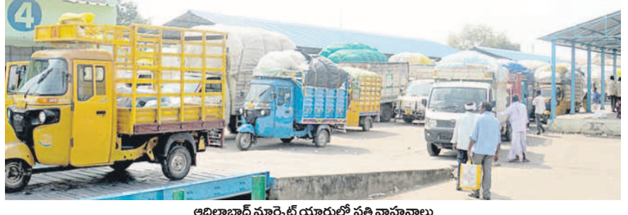
ఆదిలాబాద్ మార్కెట్ యార్డులో పత్తి వాహనాలు

రోజుకు రూ. 15 లక్షల నష్టం ఆదిలాబాద్ జిల్లాలో సీసీబితోపాటు, ప్రైవేటు వ్యాపారులు పత్తిని కొనుగోలు చేస్తారు. జిల్లావ్యాప్తంగా రోజు కనీసం 15 వేల క్వింటాళ్ల వరకు పంటను సీసీబి, 4 నుంచి 5 వేల క్వింటాళ్ల వరకు ప్రైవేటు వ్యాపారులు కొనుగోలు చేస్తారు. కేంద్ర ప్రభుత్వం ప్రకటించిన మద్దతు ధర కంటే రూ.100 తగ్గించి సీసీబి పంటను కొనుగోలు చేస్తుండడంతో రైతులు రోజుకు రూ.15 లక్షల వరకు నష్టపోవాల్సి వస్తున్నది. మొదట పదిహేను రోజులు రూ.50, మరోసారి రూ.100 తక్కువ ధరతో చెల్లించడంతో రైతులు కోట్ల రూపాయలను నష్టపోయారు. పంట నాణ్యత విషయంలో మార్పు లేదని