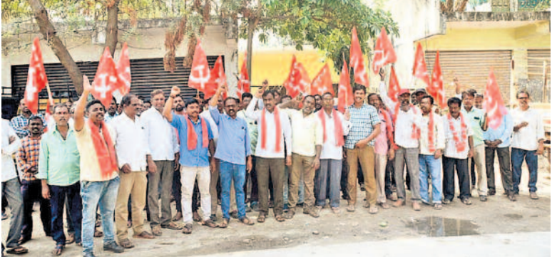
సిరిసిల్ల పట్టణంలోని వేనేత జాగ్రాణ కార్యాలయం ఎదుట ధర్మా చేస్తున్న నేతనల్లు