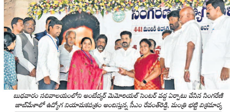
బుధవారం సచివాలయంలోని అంబేద్కర్ మెమోరియల్ సెంటర్ వద్ద ఏర్పాటు చేసిన సింగరేణి జాబ్ మేకాలో ఉద్యోగ నియామకపత్రం అందిస్తున్న సీఎం రేవంత్ కింద, మంత్రి భట్టి విక్రమార్కు

హైదరాబాద్, ఫిబ్రవరి 7 (నమస్తే తెలంగాణ): త్వరలోనే గ్రూప్-1 నోటిఫికేషన్ విడుదల చేస్తామని, ఉద్యోగాలకు రెండేండ్ల వయోపరిమితి ఇవ్వనున్నట్లు ముఖ్యమంత్రి రేవంత్ కింద తెలిపారు. బుధవారం సచివాలయంలోని అంబేద్కర్ మెమోరియల్ సెంటర్ వద్ద ఏర్పాటు చేసిన సింగరేణి జాబ్ మేకాలో 441 మందికి సీఎం కాబుల్లు నియామక పత్రాలు అందించారు. ఈ సందర్భంగా ఆయన మాట్లాడుతూ ఖాతా పోస్టులను త్వరలోనే భర్తీచేస్తామని తెలిపారు. జాబ్ క్యాలెండర్ ప్రకారం ఉద్యోగాలు భర్తీచేస్తామని, నిరుద్యోగుల సమస్యలకు కావాలని పేర్కొన్నారు. పోలీస్ రిక్రూట్ మెంట్ లో 15వేల అప్లీ 15వేల పోలీసులు నియామకాలు చేపడతామని పేర్కొన్నారు.