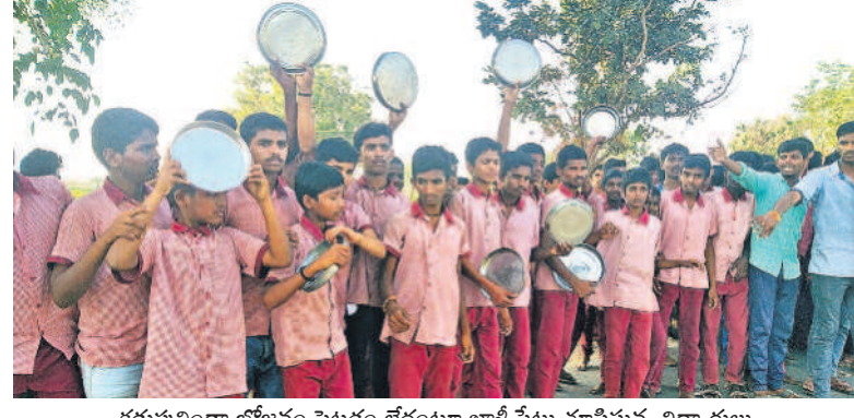
కడుపునొందా భోజనం పెట్టడం లేదంటూ భోజనం పట్టు మామిస్తున్న విద్యార్థులు

ధర్మారు, ఫిబ్రవరి 7: విద్యార్థులలో విషవాక్య మార్కులు తీసుకొచ్చేందుకు కేసీఆర్ ప్రభుత్వం గురుకుల పాఠశాలలను ఏర్పాటు చేసి.. విద్యార్థులకు నాణ్యమైన భోజనంకోసం మెరుగైన విద్యనందించింది. కానీ.. ప్రస్తుతం కాంగ్రెస్ పాలనలో విద్యార్థులు రోడ్డుకే పరిస్థితి నెలకొన్నది. జోగూరిపల్లి గద్దూరు జిల్లా ధర్మారు మండలం ర్యాలంపాడు రిజర్వాయర్ హెడ్ క్వార్టర్స్ లో నిర్వహిస్తున్న కేటీడీ మండలాలికి చెందిన టీ పి కె 11 నగరించిన విద్యార్థులు ఆవేదన అందుకు నిరర్హనం. ఇందులో 5వ తరగతి నుంచి ఇంటర్ వరకు 500 మంది విద్యార్థులు చదువుకుంటున్నారు. పాఠశాలలో భోజనంలో మెనూ పాటించడం లేదని, సగం సగం భోజనం పెట్టడంతో కడుపు మాడ్చుకొని చదువుకు