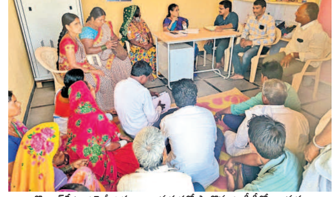
బొంబాయిలోని తాగునీటి సౌకర్యం గ్రామంలోని పరిశీలిస్తున్న ఎంపీఎస్, గ్రామస్థులు