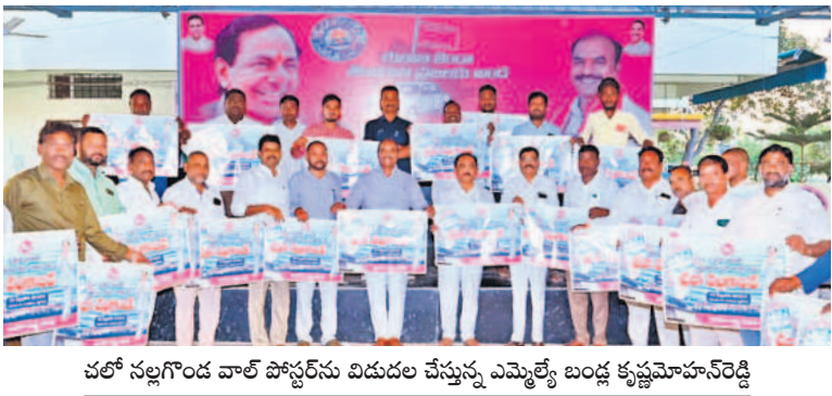
చలో నల్లగొండ వాల్ పోస్టర్స్ను విడుదల చేస్తున్న ఎమ్మెల్యే బండ కృష్ణమోహన్ రెడ్డి