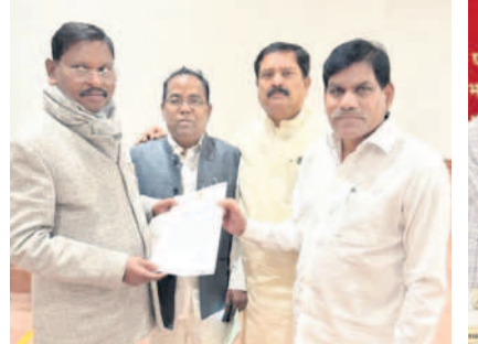
కేంద్ర మంత్రులకు వినవినవ్రం అందజేస్తున్న ఎంపీలు, ఎమ్మెల్యే

మంచూబ్ నగర్ అర్ధన, ఫిబ్రవరి 8 : తెలంగాణలో జాతీయ ఆయిల్ పాం బోర్డు ఏర్పాటు చేయాలని, ఆయిల్ పాం పండించే రైతులకు గిట్టుబాటు ధర కల్పించాలని బీఆర్ఎస్ ఎంపీలు మున్సిపల్ స్టోర్లను వాస్తవికంగా, రాములు, బీబీ పాటిల్ గురువారం డిల్లీలో కేంద్ర వ్యవసాయ, రైతు సంరక్షణ శాఖల మంత్రి అర్ధన ముందాను కలిసి విన్వేతనం అందించారు. ఆయిల్ పాం పండిస్తున్న రైతులకు గిట్టుబాటు ధర లేకపోవడంతో వెళ్లు బడి కూడా రావడం లేదని మంత్రి దృష్టికి తీసుకుపోయారు. ప్రస్తుతం సాగు కోసం రూ.18 వేలు ఇవ్వడంతో రైతులకు ఇబ్బందిగా మారిందని దానిని కనీసం రూ.20 వేలకు పెంచి తెలంగాణ రాష్ట్ర అయిల్ పాం రైతులను ఆదుకోవాలని వారు కోరారు.