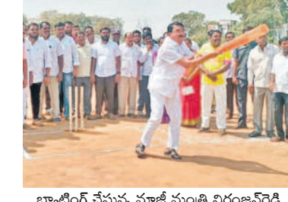
బ్యాటింగ్ చేస్తున్న మాజీ మంత్రి నిరంజన్ రెడ్డి

విషయంపై ఎంపీడివో రామయ్యను వివరణ కోరగా పెంట్లవెల్లి పం చాయతీ కార్యదర్శి వద్ద గతంతో చాలా సార్లు సమావేశం చేసుకొని ఇచ్చాను. అదే మాదిరిగానే రూ.35 వేలు చే బదులుగా తీసుకున్నవారు వాస్తవమేనని, బుధవారం గ్రామ పంచాయతీలో విరులు సక్రమంగా నిర్వహించడం లేదని, ఇది సరికాదని సూచించడం జరిగిందన్నారు. దీంతో పంచాయతీ కార్యదర్శి సాధిక్ మద్దతుగా ఎంపీడివో కార్యాలయానికి వచ్చి ఉద్యోగుల ముందు తనను కానా బాతులు తిట్టారని, విధులకు అటంకం కలిగించినందుకు పోలీస్ స్టేషన్ లో ఫిర్యాదు చేశామన్నారు. ఇదిలా ఉంటే ఆరు గ్యాంగ్ లోంటింటా కాంగ్రెస్ అధికారంలోకి వచ్చి నెల కిందల దరఖాస్తులను స్వీకరించింది. ఇచ్చిన దరఖాస్తుల వివరాలు తెలుసుకుందామని కార్యాలయానికి వచ్చిన ప్రజలకు కార్యాలయంలో అధికారులు, ఉద్యోగుల మధ్య మాటల యుద్ధం చూసి ఇదేం కార్యాలయం.. ఇదేమీ పాలన రా బాటు అని చర్చించుకోవడం కనిపించింది.