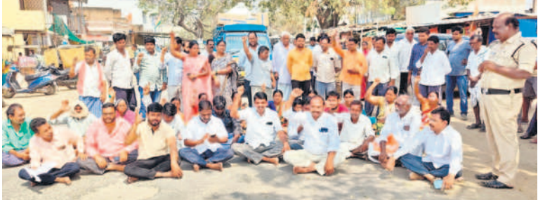
చారకొండలో రాష్ట్రారోగో చేస్తున్న గ్రామస్థులు