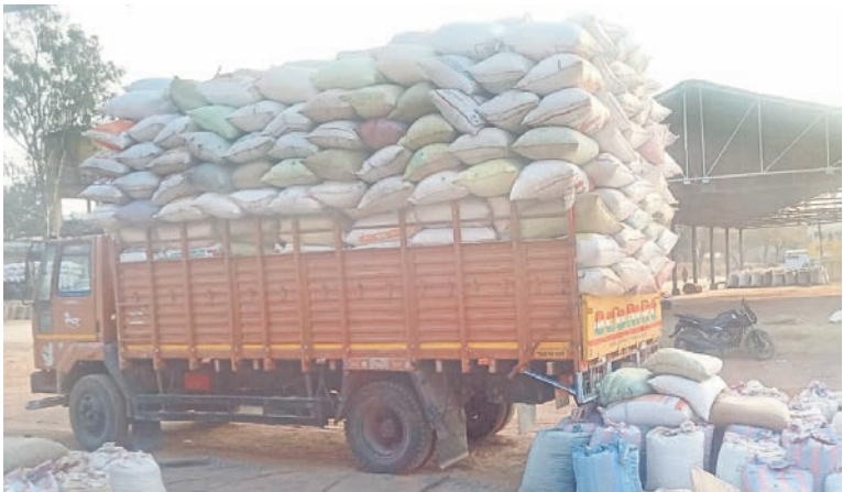
కొనుగొలుచేసిన వేరు శనగనుడి సీమంలో తరలిస్తున్న వ్యాపారులు

• చారకొండలో రాష్ట్రారోగో చారకొండ, ఫిబ్రవరి 8 : జడ్చర్ల-కొంకణి జాతీయ రహదారిలో చారకొండ వద్ద చేపట్టిన బైపాస్ రోడ్డు నిర్మాణ పనులు నిలిపివేయాలని డిమాండ్ చేస్తూ చారకొండ గ్రామస్థులు గురువారం రాష్ట్రారోగో నిర్వహించారు. ఈ సందర్భంగా వారు మాట్లాడుతూ రోడ్డు మూలములు ఉన్నాయని సాకుతో చారకొండలో బైపాస్ రోడ్డు నిర్మించడం పల్లని నిరసనలకు చెందిన ఇండ్లు, షాపులు, వ్యవసాయ భూములు కోల్పోతున్నారని ఆవేదన వ్యక్తం చేశారు. ఉన్న రోడ్డునే విస్తరిస్తే ఎవరికీ ఎలాంటి నష్టం జరగదని, ఈ విషయాన్ని పలుమార్లు ఉన్నతాధికారులు, ప్రజాప్రతినిధుల దృష్టికి తీసుకొచ్చానా చట్టం