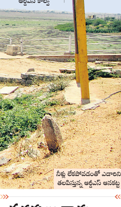
నీళ్లు లేక పట్టిపోయిన ఆర్టీఎస్ కాల్వ

మొదటి దశ పనులు పూర్తి చేసి సుంబర 2018 నుంచి సాగునీటిని అందించారు. ఈ ప్రాజెక్టు కింద 87,500 ఎకరాల అయిపోతున్నది. అయితే ఆర్టీఎస్ నీటి ద్వారా కేవలం 31,900 ఎకరాలకు మాత్రమే ప్రస్తుతం నీరు పారుతున్నది. తుమ్మిళ్ల ద్వారా గిరిని 55,600 ఎకరాలకు సాగునీరు అందించనున్నారు. అయితే ఈ ఎత్తిపోతలకు నీటిని తుమ్మిళ్ల గ్రామ సమీపంలో ఏర్పాటు చేసిన లిఫ్ట్ ద్వారా తీసుకుంటున్నారు. ప్రాజెక్టులు కృష్ణా రివర్ మేనేజ్మెంట్ బోర్డు పరిధిలోకి వెళ్లడంతో నీటిని వాడుకోనే హక్కును కోల్పోతాం. వారు అనుమతి ఇస్తే తప్ప నీటిని ఈ లిఫ్ట్ కు వాడుకోనే పరిస్థితి. రైతుల చివరి అయిపోతున్న తెలంగాణ ప్రభుత్వం నీరు అందిస్తే, ప్రస్తుత కాంగ్రెస్ ప్రభుత్వం మళ్లీ ఆ భూములను బీడు భూములుగా మార్చే ప్రయత్నం చేసింది. ఇప్పుడు మొదటి ఆర్టీఎస్ రైతుల భూములు పచ్చగా మారి రైతులు ఆర్థికంగా అభివృద్ధి చెందుతుంటే రేపంత సర్కారు నిర్ణయం వల్ల తిరిగి బీడు భూములుగా మారి పరిస్థితి నెలకొంది. ఇప్పటికే ప్రాజెక్టులను కేఆర్ఎం బీకి అప్పగించడం ప్రభుత్వం పునరాలోచన చేయాలని నడిగడ్డ రైతులు డిమాండ్ చేస్తున్నారు.