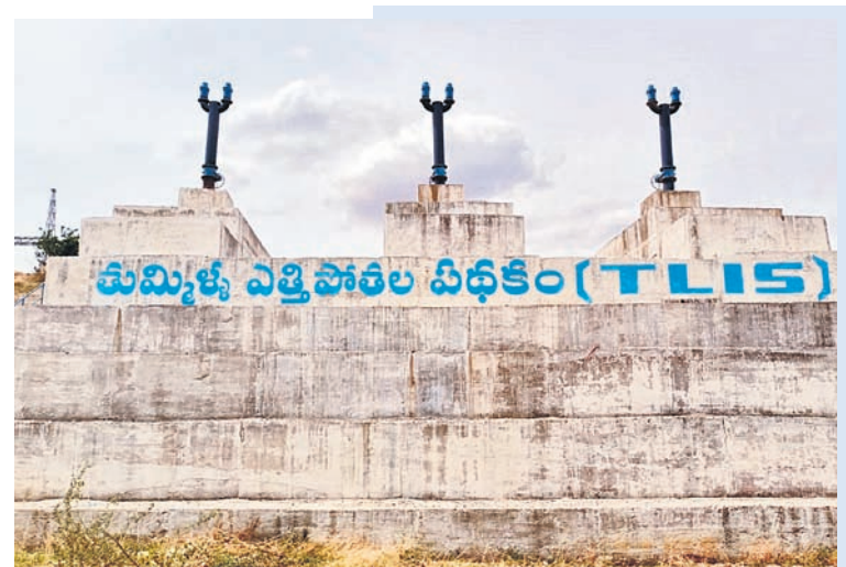
తుమ్మిళ్ల ఎత్తిపోతల పథకం