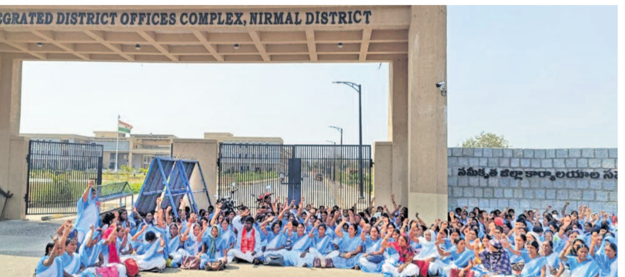
రెండునెలలుగా వేతనాలు రాకపోవడంతో ఆశా కార్యకర్తలు ఆందోళనలూట పట్టారు. రాష్ట్రవ్యాప్తంగా నిరసన ప్రదర్శనలు చేపట్టారు. రాష్ట్రప్రభుత్వం తక్షణమే తమకు వేతనాలు వెల్లించాలని డిమాండ్ చేస్తూ శుక్రవారం నిర్మల్ జిల్లా కలెక్టర్ కార్యాలయం ఎదుట ఆశా కార్యకర్తలు ధర్మాకు దిగారు.

ప్రవేశపెట్టనున్న మంత్రి భట్టివిక్రమార్క కేంద్ర గ్రాంట్లను తగ్గించే అవకాశం > 8