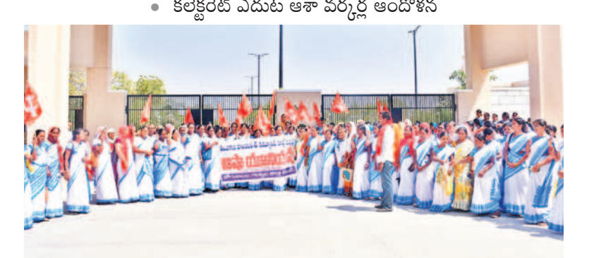
గద్వాల కలెక్టరేట్ ఎదుట ఆందోళన చేస్తున్న ఆశా కార్యకర్తలు

గద్వాల, ఫిబ్రవరి 9 : పెండింగ్ లో ఉన్న పారితోషికాలను చెల్లించాలని, గత ప్రభుత్వ హామీలను అమలు చేయాలని కోరుతూ ఆశా వర్షం కలెక్టరేట్ ఎదుట శుక్రవారం ఆందోళన చేపట్టారు. ఈ సందర్భంగా వారు మాట్లాడుతూ గత ప్రభుత్వం ప్రతి నెలా 2వ తేదీన తమ ఖాతాల్లో పారితోషికాల జమ చేసేదని ప్రస్తుతం రెండు నెలల దాటినా వాటిని చెల్లించక పోవడంతో అప్పులు చేయాల్సి వస్తున్నదని వాపోయారు. అభయపాపం, మహా లక్ష్మి వంటి అదనపు పనులు చేయిస్తున్నారని, వాటిని తమకు అప్పగించాల్సి కోరారు. ఏఎన్ డివిజన్ లో పేరుకు టార్గెట్ పెట్టి భయభ్రాంతులకు గురిచేసి విధానాన్ని రద్దు చేయాలని, సమ్మె సందర్భంగా ఇచ్చిన హామీలు నెరవేర్చాలని డిమాండ్ చేశారు. ప్రమాద బీమా కింద చాలా 5లక్షలు చెల్లింపాలని, ప్రమాదాన్ని ప్రస్తుతి సెలవులు వంటి పలు డిమాండ్లతో కూడిన వినవలెనైనా కలెక్టరేట్ ఏవో కు అందజేశారు.