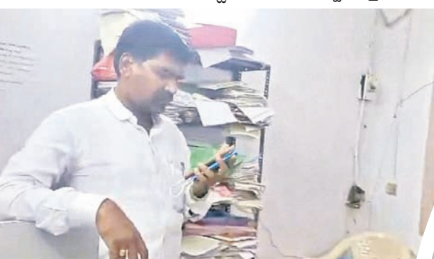
తానీల్డార్ కార్యాలయం లికాద్ గదిలో మాజీ సర్పంచ్ బోడెనాయక్

జూనియర్ ఆ సిస్టంట్, మాజీ సర్పంచ్ పై కేసు నమోదు