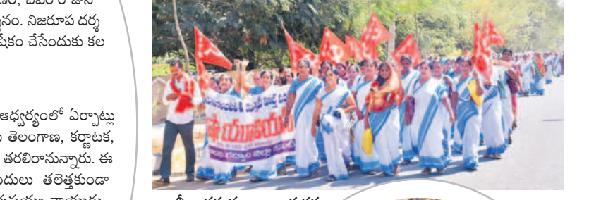
రాల్ గా వస్తున్న ఆశా కార్యకర్తలు

గద్వాల, ఫిబ్రవరి 9 : పెండింగ్ లో ఉన్న పారితోషికాలను చెల్లించాలని, గత ప్రభుత్వ హామీలను అమలు చేయాలని కోరుతూ ఆశా వర్షం కలెక్టరేట్ ఎదుట శుక్రవారం ఆందోళన చేపట్టారు. ఈ సందర్భంగా వారు మాట్లాడుతూ గత ప్రభుత్వం ప్రతి నెలా 2వ తేదీన తమ ఖాతాల్లో పారితోషికాల జమ చేసేదని ప్రస్తుతం రెండు నెలల దాటినా వాటిని చెల్లించక పోవడంతో అప్పులు చేయాల్సి వస్తున్నదని వాపోయారు. అభయపాపం, మహా లక్ష్మి వంటి అదనపు పనులు చేయిస్తున్నారని, వాటిని తమకు అప్పగించాల్సి కోరారు. ఏఎన్ డివిజన్ లో పేరుకు టార్గెట్ పెట్టి భయభ్రాంతులకు గురిచేసి విధానాన్ని రద్దు చేయాలని, సమ్మె సందర్భంగా ఇచ్చిన హామీలు నెరవేర్చాలని డిమాండ్ చేశారు. ప్రమాద బీమా కింద చాలా 5లక్షలు చెల్లింపాలని, ప్రమాదాన్ని ప్రస్తుతి సెలవులు వంటి పలు డిమాండ్లతో కూడిన వినవలెనైనా కలెక్టరేట్ ఏవో కు అందజేశారు.