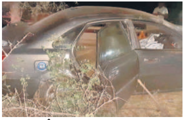
బీభత్సం సృష్టించిన కారు

కొత్తకోట, ఫిబ్రవరి 9 : పులిగా మధ్యం తాగిన వ్యక్తి కారు నడిపి బీభత్సం సృష్టించిన ఘటనలో ఒకరు మృతి చెందగా ముగ్గురికి గాయాలయ్యాయి.