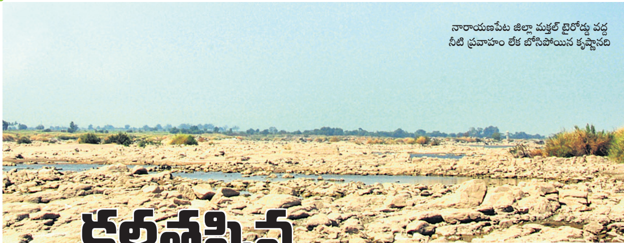
నారాయణపేట జిల్లా మత్తలో టైరోడ్డు వద్ద నీటి ప్రవాహం లేక బోసిపోయిన కృష్ణానది