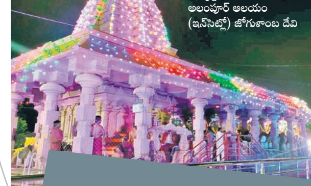
విద్యుత్తు కంతుల్లో అలంపూర్ అలయం జోగులం దేవి