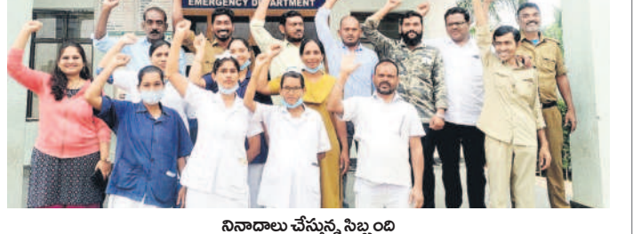
నినాదాలు చేస్తున్న సిబ్బంది