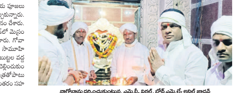
పూజలందుకుంటున్న నాగోబా విగ్రహం