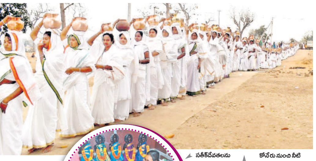
సతీక దేవతలను దర్శించుకుంటున్న కార్తవీర్యులు