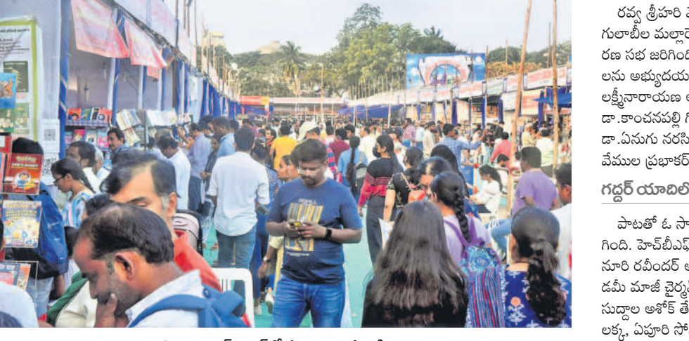
శనివారం బుక్ ఫెయిర్లో సందర్శకుల సందడి