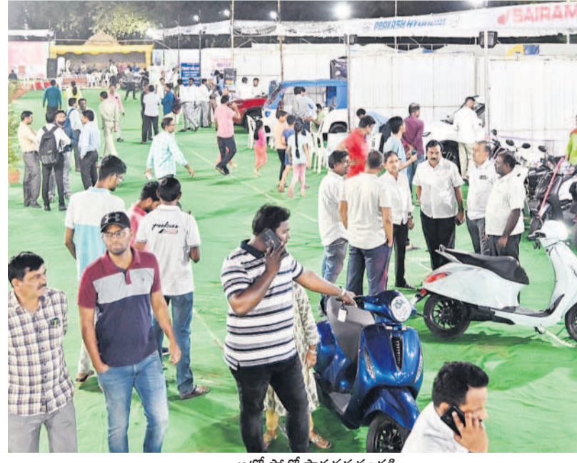
ఆటో షోలో స్టాళ్ల వద్ద సందడి