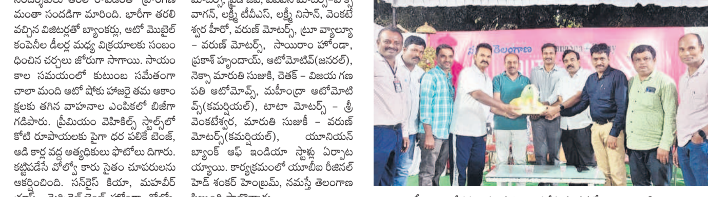
లక్ష్మీ ద్రా విజేతలకు బహుమతి అందజేస్తున్న నమస్తే తెలంగాణ నిబ్బంది