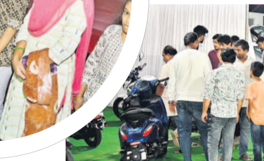
తరగతులను కోటి రూపాయల వాహనాలు...

ఆటో షో చాలా భాగస్వామి ఆటో షో చాలా భాగస్వామి. ఇక్కడ అన్ని రకాల బైక్లు ఉన్నాయి. ఎలక్ట్రికల్ వాహనాలు సైతం అందుబాటులో ఉంచారు. టోరూలం చుట్టూ తిరిగి పనిలే కుండా తక్కువ సమయంలో సెలెక్ట్ చేసుకోవచ్చు. ఆయన కంపెనీలకు చెందిన స్కూటీలను పరిశీలించిన. - రేణుక, గాంధారి