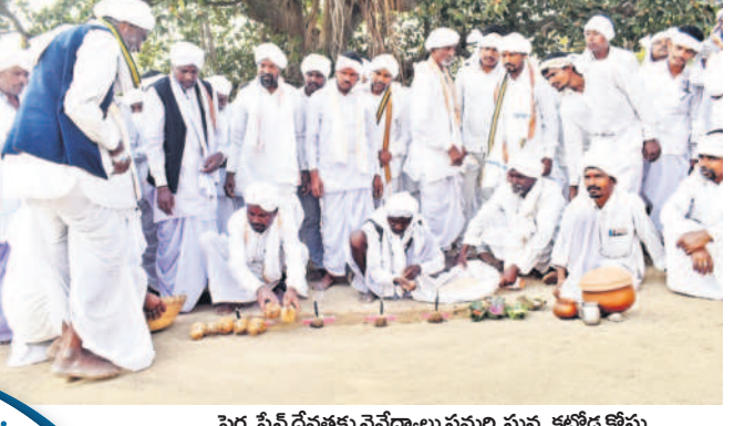
పెర్వసేన్ దేవతకు నైవేద్యాలు సమర్పిస్తున్న కబోడ కోసు