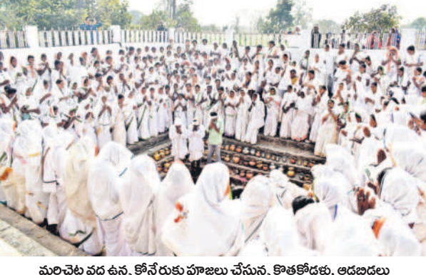
మల్లపాళ్ల వద్ద ఉన్న కోనేరుకు పూజలు చేస్తున్న కొత్తకోడళ్ళు, ఆడబద్దలు