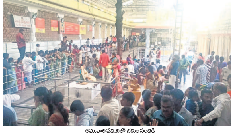
అమ్మవారి సన్నిధిలో భక్తుల సందడి