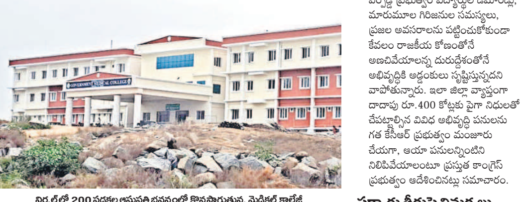
నిర్మల్ లో 200 పడకల అనువర్తింపంలో కొనసాగుతున్న మెడికల్ కాలేజీ

నిర్మల్, ఫిబ్రవరి 11(నమస్తే తెలంగాణ) : నిర్మల్ జిల్లాలోని గిరిజన గూడేలు, తండాలు, పల్లిలు వసతులు లేక తల్లిడిల్లాయి. సమస్యల పరిష్కారానికి కేసీఆర్ సర్కారు దాడులు రూ.400 కోట్లు కేటాయించింది. ఇందులో రోడ్డు నిర్మించేందుకు ఎస్టీ ఎన్డీఎఫ్ పథకం కింద రూ.120 కోట్లు, లోక్సత్తరం మండలం లోని పురాతన అర్బి(టి) పంచెత్త నిర్మాణానికి రూ.46 కోట్లు, మెడికల్ కాలేజీ ఏర్పాటుకు రూ.166 కోట్లు.. ఇలా వివిధ అభివృద్ధి పనుల కోసం కేసీఆర్ ప్రభుత్వం మంజూరు చేసింది. ఇంతలో అసెంబ్లీ ఎన్నికల కోడ్ రావడం, కాంగ్రెస్ సర్కారు అధికారంలోకి రావడంతో అభివృద్ధి పనులు నిలిచిపోయాయి. ఇలా కేసీఆర్ సర్కారు మంజూరు చేసిన నిధులు, పనులను కాంగ్రెస్ ప్రభుత్వం ఎక్కడిక్కడ నిలిపివేస్తూ రాజకీయ కోణంతో ఆటంకాలు సృష్టిస్తుండడం విమర్శలకు తావిస్తున్నది. అధికారులకు అంతర్గతంగా ఆడినాల్ వ్యవధం విశ్వసనీయంగా తెలిసింది. ● లోక్సత్తరం మండలంలోని లోక్సత్తరం, కుంటూల, సర్కారు (జి) మండలాలను అనుసంధానించే పురాతన అర్బి(టి) పంచెత్త నిర్మాణానికి కేసీఆర్ ప్రభుత్వం రూ.46 కోట్లను మంజూరు చేసింది. అప్పటి ఎమ్మెల్యే విఠల్ రెడ్డి, స్థానికుల విజ్ఞప్తి మేరకు నిర్ణయం తీసుకున్నారు. కానీ.. టిఆర్ఎస్ సర్కారుకు క్రెడిట్ దక్కతుందన్న అసూయతో కాంగ్రెస్ ప్రభుత్వం పనులు చేపట్టవద్దని సంబంధిత శాఖ