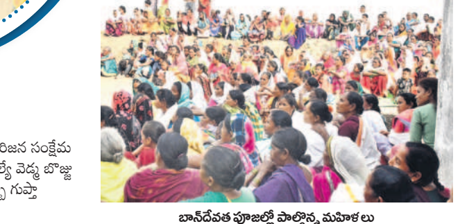
బాన్ దేవత పూజల్లో పాల్గొన్న మహిళలు