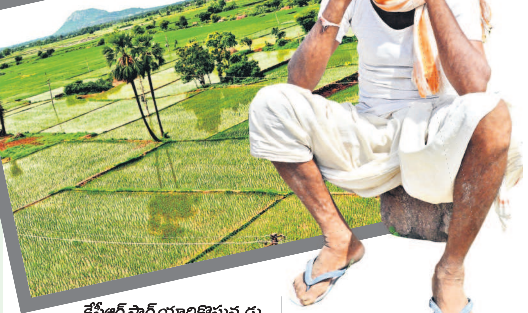
కేసీఆర్ సార్ యాదికొస్తున్నాడు..