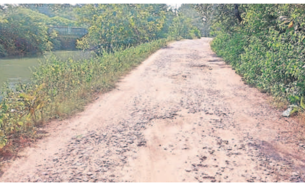
కడం మండలంలోని పాండవపూర్ నుంచి డ్యాంగూడ వరకు నిలిచిన రోడ్డు పనులు