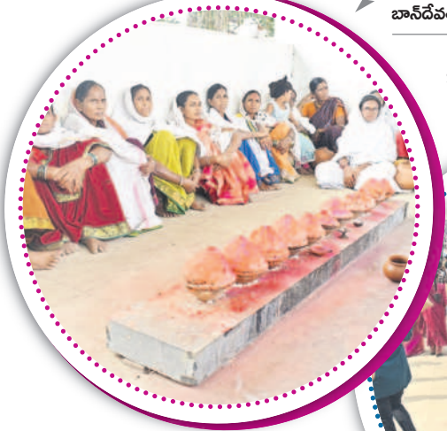
బాన్ దేవత పూజలకు వచ్చిన మహిళలు

బాన్ దేవత ఆలయం నుంచి కోనేరుకు తెచ్చిన కొత్తకోడళ్ళు, ఆడపదుచులు