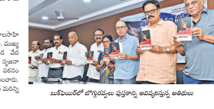
బుక్ ఫెయిర్లో బోధనలు పుస్తకాన్ని అవిష్కరిస్తున్న అతిథులు