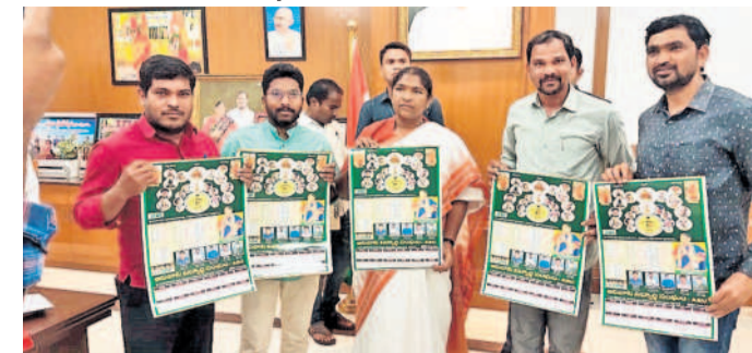
అదివాసీ విద్యార్థి సంఘం క్యాలెండర్ను అవిష్కరిస్తున్న మంత్రి సీతక్క

సికింద్రాబాద్, ఫిబ్రవరి 11 : అదివాసీ విద్యార్థి సంఘం అధ్యక్షులతో రూపొందించిన 2024 క్యాలెండర్ ను పంచాయతీ రాజ్, మహిళా, శిశు సంక్షేమ శాఖ మంత్రి సీతక్క ఆదివారం తన సోమవారం అవిష్కరించారు. క్యాలెండర్ను ఉన్నతమైన ఆలోచనలను రేఖించేలా రూపొందించడం అభి