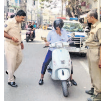
వారాసిగూడ నుంచి టర్నింగ్ పాయింట్ వైళ్ల రోడ్డు వద్ద తనిఖీ నిర్వహిస్తున్న పోలీసులు

సికింద్రాబాద్, ఫిబ్రవరి 11 : వారాసిగూడ పోలీస్ స్టేషన్ పరిధిలో పోలీసులు ఆదివారం వాహనాల తనిఖీలు చేపట్టారు. ఆదివారం మధ్యాహ్నం నుంచి వారాసిగూడ నుంచి టర్నింగ్ పాయింట్ వైళ్ల రోడ్డు వద్ద వాహనాల తనిఖీ నిర్వహించారు. అనుమానం ఉన్న వాహనాలు, నంబర్ ప్లేటు సరిగా లేని వాహనాలు, పెండింగ్ చాలానాలు ఉన్నా, హెల్మెట్ లేకున్నా, పాల్స్టాప్ పని పత్రాలను అడిగి తీసుకున్నారు. వాహనాలను క్రమంగా తనిఖీలు చేశారు. అలాగే వాహనాలపై ముగ్గురు వెళ్లిన కలిసే చర్యలు తప్పవని పోలీసులు హెచ్చరించారు.