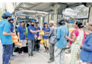
స్ట్రాఫోండ్ పని అధ్యక్షులతో అన్నదానం

సికింద్రాబాద్ జోనల్ కార్యాలయంలో సోమవారం 'ప్రజావాణి' కార్యక్రమం నిర్వహిస్తున్నట్లు డి.సీ. సుధాకర్ ఆదివారం ఒక ప్రకటనలో తెలిపారు. ప్రజావాణి కార్యక్రమం ప్రజల సమస్యలు తీర్చడానికి అని, ప్రజల సమస్యలకు తక్షణ పరిష్కార మార్గం చూపడానికి ప్రత్యేకంగా ఏర్పాటు చేశారన్నారు. ప్రజలు ప్రజావాణిలో పాల్గొని సమస్యలను అధికారుల దృష్టికి తీసుకురావాలని సూచించారు. ప్రతివారం సోమవారం ఉదయం పదిన్నర గంటల నుంచి మధ్యాహ్నం 1 గంట వరకు ప్రజావాణి ఉంటుందని తెలిపారు.