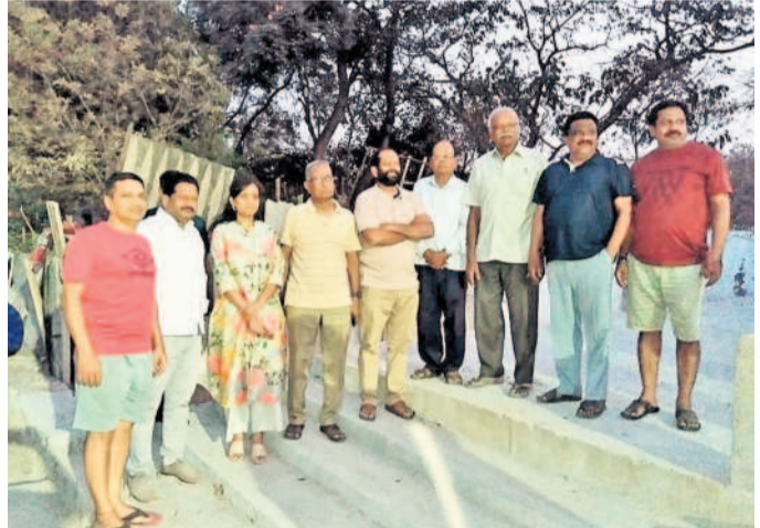
జవహర్ రైల్వే కాలనీ వాసులతో మాట్లాడుతున్న ఎమ్మెల్యే లాస్కర్ నందీ

కంటోన్మెంట్, ఫిబ్రవరి 11 : నేరాల నియంత్రణకు సీసీ కెమెరాల దోహదం చేస్తాయని కంటోన్మెంట్ ఎమ్మెల్యే లాస్కర్ నందీ అన్నారు. ఆదివారం ఆరో వార్డులోని జవహర్ రైల్వే కాలనీలో ఏర్పాటు చేసిన సీసీ కెమెరాలను బోర్డు మాజీ సభ్యుడు పాండుయ్యదమ్మ, కాలనీ వాసులతో కలిసి ఎమ్మెల్యే ముఖ్యఅధికారి పాల్గొని ప్రారంభించారు. ఈ సందర్భంగా సీసీ కెమెరాల ఏర్పాటుకు ముందుకు వచ్చిన