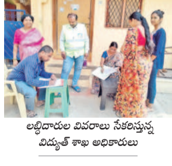
లబ్ధిదారుల వివరాలు సేకరిస్తున్న విద్యుత్ శాఖ అధికారులు

సికింద్రాబాద్, ఫిబ్రవరి 11 : గృహ జ్యోతి పథకాన్ని సర్వేయాలని చేపట్టాలని విద్యుత్ శాఖ అధికారులు ప్రచారం నిర్వహిస్తున్నారు. పలు ప్రాంతాల్లో ఇంటింటికీ వెళ్లి