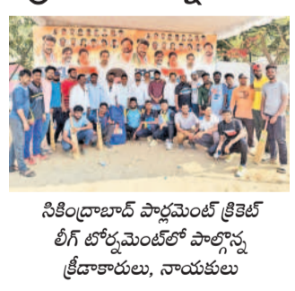
సికింద్రాబాద్ పార్లమెంట్ క్రికెట్ లీగ్ టోర్నమెంట్లో పాల్గొన్న క్రీడాకారులు, నాయకులు