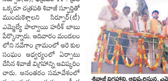
శివాజీ విగ్రహాన్ని అభిషేకం చేశారు