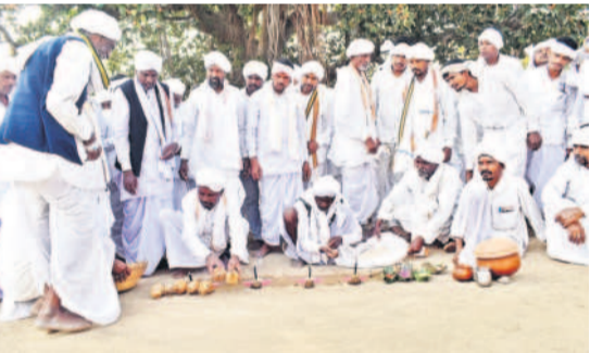
పెర్మినీ దేవతకు నైవేద్యాలను అర్పిస్తున్న కటోడ కోసు

నాగోబా ఆలయం వెనుక భాగంలో ఉన్న బా న దేవతలకు మొదలం పంశీయుల మహోళలు గిరిజన సంప్రదాయం ప్రకారం పూజలు చేశారు. గోదావరి విశ్రాంతి పొందుతున్న మహిళా లోకంపాటు కొత్తకోడళ్లను సంప్రదాయ వాయిద్యాల మధ్య సటివేదంతో వద్దకు తీసుకొ