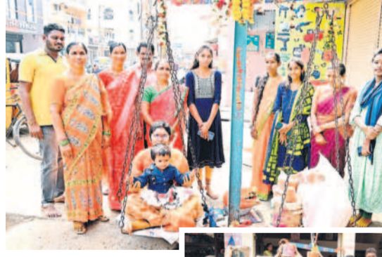
తరాజో బంగారం తుంకా మేయం చుకుంటున్న భక్తులు