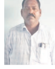
భారత్ బీకే. రైతు, పెంచితల్ పేట్

పెంచితల్ పేట్, ఫిబ్రవరి 11 : నాకు ఎల్లూరు శివారలో ఐదేకరాల ఉంది. వానకాలంలో వరి పండించిన. సరైన కొనుగోలు సెంటర్ లేక కిందా.. మీదా పడి మధ్యవర్తులకు పంట అమ్ముకున్న. గిట్టుబాటు ధర కంటే రూ. 100 తక్కువకే అమ్మాలి వచ్చింది. యాసంగి పంట వేధామంతో కరెంటు కోతలు మొదలైయ్యాయి. కాంగ్రెస్ పార్టీ అధికారంలోకి రావడం రైతులకు శాపంగా మారింది. గద్దె మీద ఎక్కానే పెంచిన రైతుబంధుతో పాటు రూ. 2 లక్షలు రుణమాఫీ చేస్తామని నమ్మించి గొంతుకోసింది. కనీసం ఇప్పటివరకు రైతుబంధుకు దిక్కులేదు. పెట్టుబడి అందక. కరెంటు మీద నమ్మకం లేక యాసంగి రెండో పంట వేయలే. కాంగ్రెస్ సర్కారు పుణ్యమాని రైతులు ఇబ్బందులు పడాలి వస్తుంది. ఇప్పటికైనా రైతులను ఆదుకోవాలే.