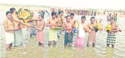
చెన్నూర్ గోదావరిలో అమ్మవార్లకు అభిషేకాలు చేస్తున్న భక్తులు

కోటపల్లి, ఫిబ్రవరి 11 : ఎదులబండలోని లక్ష్మీదేవర-ముత్యాలమ్మ జాతరను సోమవారం నుంచి నిర్వహించనున్నట్లు ఎంపీటీసీ జేకేశ్వర్, జాతర నిర్వాహకులు తెలిపారు. ఈ మేరకు ఆదివారం ఆదివాసీ నాయకపోర్టు అమ్మవార్ల విగ్రహాలను చెన్నూర్ గోదావరి నదికి తీసుకొచ్చి అభిషేకాలు నిర్వహించారు. అనంతరం ప్రత్యేక పూజలు చేశారు. సాయంత్రం తిరిగి ఆలయానికి విగ్రహాలను తీసుకొచ్చారు. పోవమ్మకు బోనాలు సమర్పించారు. జాతరకు పెద్ద సంఖ్యలో భక్తులు తరలిరానుండగా, నిర్వాహకులు అన్ని ఏర్పాట్లు చేశారు.