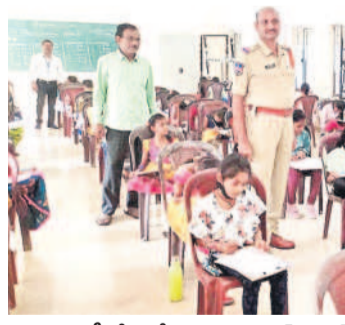
బెల్లంపల్లి సీనియర్ గురుకుల కామిన ఎల్ టీఎస్ టిఎస్ పరిశీలనను, రూరల్ సీనియర్ టీఎస్