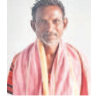
చిన్నబోయిన చినస, రైతు, పెంచితల్ పేట్

పెంచితల్ పేట్, ఫిబ్రవరి 11 : కేసీఆర్ సర్కారులో పంటలకు ముందే రైతుబంధు డబ్బులేనట్టోళ్లు. రంది లేకుండా ఎప్పుడూ చేసుకునేట్టోళ్లు. కాంగ్రెస్ సర్కారు రాంగనే రైతులను గోస పెడుతుంది. నాకు బొక్కె వాగు ప్రాజెక్టు కింద ఐదేకరాల పొలముంది. ఎట్లవో అట్ట తిప్పల పడి పంట వేసిన. మందులు, కూలిలు, విత్తనాలకు అప్పు తెచ్చి పెట్టిన. కొత్త ప్రభుత్వం వచ్చి గిన్ని రోజులైనా రైతుబంధు పంపించాలి. ఆనాడు కరెంటు కోసిన.. ఎదురుకోసం చెప్పారు పెట్టే ధర్నాలు చేసినం. మళ్లీ గసాంటి పట్టెనే వస్తుంది.