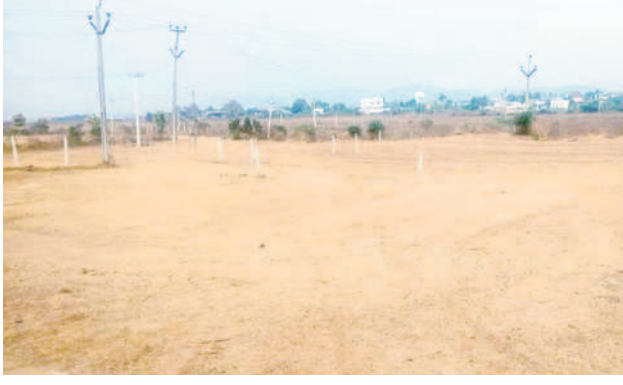
ఈ స్థలంలోనే 2014 కంటే ముందు నుంచి ఇండ్లు ఉన్నట్లు..నాటిలో నివాసముంటున్నట్లు గ్రామ పంచాయతీ నకిలీ రసీదులను సృష్టించారు

కుటుంబం ఆసిఫాబాద్, ఫిబ్రవరి 12 (నమస్తే తెలంగాణ) : ఆసిఫాబాద్ పట్టణంలోని ప్రభుత్వ భూములను కాజేసేందుకు అధికారులు నకిలీ పత్రాలు సృష్టించి రంగం సిద్ధం చేశారు. ఇబ్బలేక ప్రభుత్వ స్థలాల్లో గుడి సెలు వేసుకొని ఏక తరబడి నివాసముంటున్న పేదలకు న్యాయం చేసి ఉద్దేశంతో గత సర్కారు తీసుకొచ్చిన 58, 59 జీవోలను దుర్వినియోగం చేసి అల్లిపాండేందుకు సిద్ధమయ్యారు. 2016 ఆక్టోబర్ లో కుటుంబం ఆసిఫాబాద్ జిల్లా ఏర్పడిన తర్వాత.. జిల్లాకు వచ్చిన అధికారులు, ఇతర ప్రైవేట్ సంస్థల్లో పని చేసే ఉద్యోగులు.. 2014 కంటే ముందు నుంచే జిల్లాలో నివాసముంటున్నట్లు నకిలీ రసీదులను సృష్టించి, ప్రభుత్వ స్థలాలను స్వాధీనం చేసేందుకు సర్కారు సిద్ధం చేశారు. ఓ జిల్లా స్థాయి అధికారి (ప్రస్తుతం బిడీపీ అయ్యారు) అండదండలతో నకిలీ ద్రువ పత్రాలు సృష్టించి అసెస్సర్ ద్వారా దరఖాస్తు చేసుకున్నారు. కాగా, ఆ జిల్లా స్థాయి అధికారితో పాటు మరెవరో మంది అధికారులు కూడా నకిలీ ద్రువ పత్రాలతో జీవో 58, 59ల ద్వారా ప్రభుత్వ స్థలాన్ని కాజేసేందుకు యత్నించడం కొనసాగిస్తున్నాడు. ఈ విషయం ప్రస్తుతం రెవెన్యూ శాఖలో చర్చనీయాంశంగా మారింది.