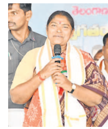
దర్బార్ లో మాట్లాడుతున్న మంత్రి సీతక్క