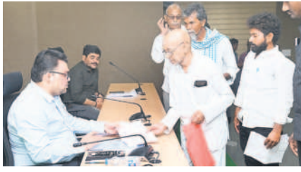
దరఖాస్తులు స్వీకరిస్తున్న కలెక్టర్ బదావత్ సంతోష్

సన్మార్గ, ఫిబ్రవరి 12 : ప్రజావాణిలో వచ్చిన సమస్యలను అధికారుల సమన్వయంతో పరిష్కరిస్తామని కలెక్టర్ బదావత్ సంతోష్ అన్నారు. సోమవారం సన్మార్గ లోని కలెక్టరేట్లో నిర్వహించిన ప్రజావాణిలో బెల్లంపల్లి ఆర్డీవో హరికృష్ణతో కలిసి అధికారుల నుంచి దరఖాస్తులు స్వీకరించారు. మంచీర్యాల, మందమర్రె, లక్ష్మిపేట, జన్నారం, కన్నెపల్లి, తాండూర్, బెల్లంపల్లి తదితర ప్రాంతాల నుంచి వచ్చిన వారు దరఖాస్తులు అందజేశారు. కలెక్టర్ మాట్లాడుతూ ప్రజావాణిలో వచ్చిన ప్రతి దరఖాస్తును క్షణంగా పరిశీలించి పరిష్కరిస్తామని, రాష్ట్ర స్థాయిలో అందిన దరఖాస్తులపై ప్రత్యేక దృష్టి సారించి పరిష్కారానికి ప్రాధాన్యమివ్వాలని ఆదేశించారు.