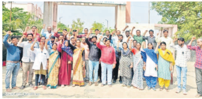
బెల్లంపల్లి సీఈఓ ఎదుట నల్ల బ్యాడ్జిల్లు ధరించి నిరసన వ్యక్తం చేస్తున్న గురుకుల ఉద్యోగులు