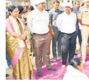
గోవాలో మొదటి వంశీయుల కొత్తకోడళ్లతో చర్చిస్తున్న మంత్రి సీతక్క