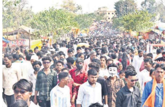
నాగోబా దర్బారునికి తరలివచ్చిన భక్తులు