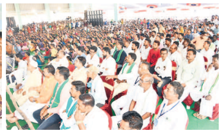
దర్బార్ లో పాల్గొన్న ప్రజలు