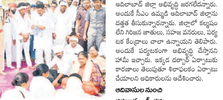
అధికారుల నుంచి దరఖాస్తుల స్వీకరణ