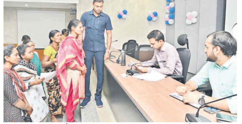
దరఖాస్తులు స్వీకరిస్తున్న కుటుంబం ఆసిఫాబాద్ కలెక్టర్ హేమంత్ సహదేవరావు