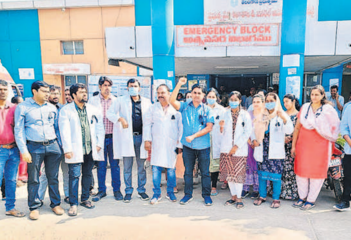
విలయా దవాఖాన వద్ద నల్లబ్యాడ్జీలతో నిరసన తెలుపుతున్న వైద్యులు

ఆర్ఎంపీ, పీఎంపీల ఆగడాలు పై కొందరు ఫిర్యాదు చేయగా కొంతమంది జిల్లా వైద్యారోగ్యశాల నిర్వాహకులు అంగీకరింపని వచ్చి సిబ్బందికి ముందుగా చెప్పి తెలియజేయమని కోరుకుంటున్నారంటూ అసహనం వేస్తూ వచ్చి కేసులు పెట్టమని కోరుకుంటున్నారు. అయితే ఆర్ఎంపీ, పీఎంపీలతో కమీషన్లు మాట్లాడుకుంటుండడం విశేషం.