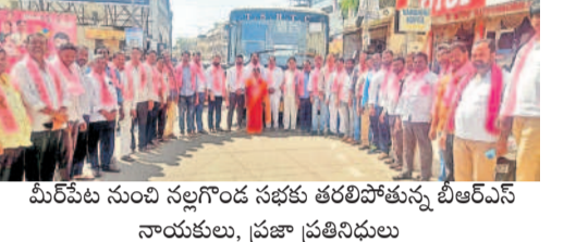
మీరపేట నుంచి నల్లగొండ సభకు తరలిపోతున్న బీఆర్ఎస్ నాయకులు, ప్రజా ప్రతినిధులు