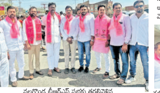
నల్లగొండ బీఆర్ఎస్ సభకు తరలివెళ్లిన ఎల్సీనగర్ నియోజకవర్గం నాయకులు