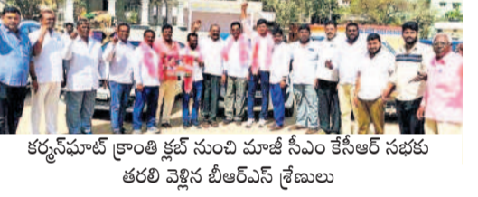
కర్నూలులో క్రాంతి క్షేత్ర నుంచి మాజీ సీఎం కేసీఆర్ సభకు తరలివెళ్లిన బీఆర్ఎస్ శ్రేణులు