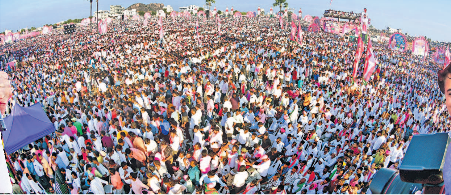
నల్లగొండలో బహిరంగ సభకు పెద్ద ఎత్తున హాజరైన జనం