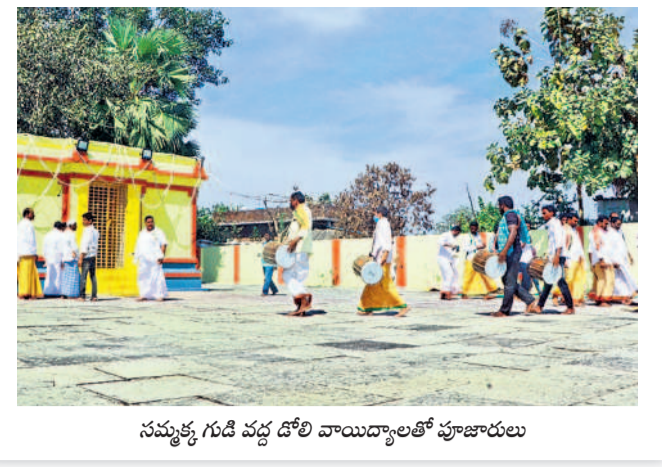
సమ్మక్క గుడి వద్ద డోలి వాయిద్యాలతో పూజారులు