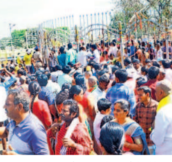
అమ్మవారి గద్దెల వద్ద భక్తులు

తా.దా.యం, ఫిబ్రవరి 14 : వన జాతర మేడారానికి భక్తులు భారీగా తరలివస్తున్నారు. మహా జాతరకు మరో ఆరురోజులే ఉండడంతో తల్లులకు ముందస్తు మొక్కులు చెల్లిస్తున్నారు. వరాలిచ్చే సమ్మక్క-సారలమ్మలను దర్శించుకోని దీవెనలు పొందుతున్నారు. బుధవారం పూజారులు మండె మెలిగే పండుగ నిర్వహిస్తుండడంతో వివిధ ప్రాంతాల నుంచి తరలివచ్చారు. అట్లీసీ, సైవేల్ వాహనాల్లో వచ్చిన వారు మొదటి జంపస్తువాగులో పుణ్యస్నానాలు చేసి వాగు ఒడ్డున ఉన్న నాగులమ్మ, జంపస్తు గద్దెలకు ప్రత్యేక పూజలు చేశారు. అనంతరం కల్వణకట్టలో తలనీలాల సమర్పించి గద్దెల వద్దకు చేరుకున్నారు. సమ్మక్క-సారలమ్మ గోవిందరాజు, పగడిదరాజు గద్దెలపై పసుపు, కుంకుమ, ఎత్తుబిల్లం, నూతన వస్త్రాలు, పూలు, పండ్లు, ఒడిబియ్యం సమర్పించి మొక్కులు చెల్లించారు. ఉదయం భక్తుల రద్దీ ఎక్కువగా ఉండడంతో ఆదిశారులు గద్దెల గ్రీల్స్ కు తాళాలు వేసి బయటినుంచే దర్శనం కల్పించారు. మధ్యాహ్నం సమయానికి రద్దీ తగ్గడంతో లోపలికి అనుమతించారు. దర్శనం అనంతరం భక్తులు గద్దెలు, జాతర పరిసరాల్లో విడిది చేశారు.