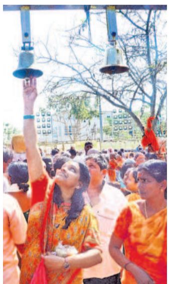
గుంట కొడుతున్న భక్తురాలు