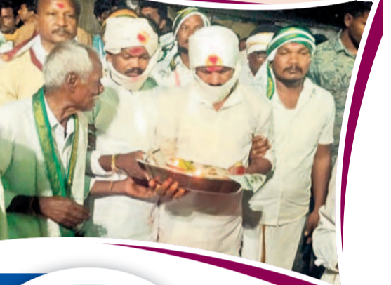
సమ్మక్క గుడి వద్దకు డోలి వాయిద్యాలతో వస్తున్న పూజారులు