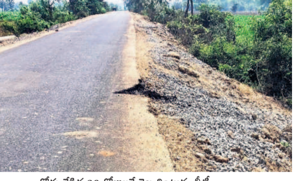
రోడ్డు వేసిన 20 రోజులకే బెల్లమిట్లను బీటీ

పరస్పరే, ఫిబ్రవరి 14: రోడ్డు నిర్మాణంలో అధికారులు నిబంధనలు పాటించక పోవడంతో వాహనదారులు తీవ్ర ఇబ్బందులు పడుతున్నారు. మండలంలోని కొత్తపల్లి ఆకేరువాగు ట్రిడ్లీ నుంచి ఇల్లంద గ్రామ సమీపంలోని బిద్వెళ్ల నదీతీర ప్రాంతంలోని బిట్లె రోడ్డు వేరు. ఈ రోడ్డుకు ఇరువైపులా సైడ్ బెల్టర్లు వేయకపోవడంతో ఎదురయ్యే వాహనాల వచ్చే క్రమంలో ప్రమాదాలు జరుగుతున్నాయి. ఎవరపాలా గ్రామంలో నడిసితో అదుపు తప్పి పంపి పాలాలో పడిపోయే ఘటనలు చిరుకొంటున్నాయి. దీనికోసం పంపి పాలా లకు వెళ్లే బాటలకు బీటీ రోడ్డు నుంచి ప్రాక్కర్లు, ఎడ్లబండ్లు వెళ్తుండడంతో నెల రోజులు కాకముందే రహదారి పాడవుతున్నది.