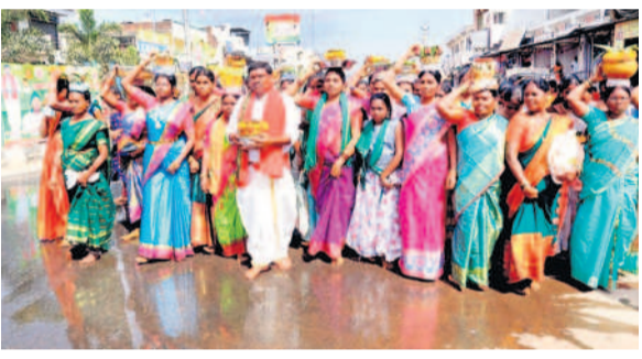
దీపం, బోనాలతో తరలివస్తున్న గట్టమ్మ పూజారులు

ములుగురవారం, ఫిబ్రవరి 14 : ఆదిదేవత గట్టమ్మకు బుధవారం ఎదురుపిల్ల పండుగను ఆదివాసీ నాయకపోడు పూజారులు, కులస్తులు ఘనంగా నిర్వహించారు. ఉదయం ఆచార, సంప్రదాయాల నడుమ 101 ఇండ్లలో వండిన నైవేద్యంతో నాయక పోడు కమ్యూనిటీ హాల్ వద్దకు చేరుకున్నారు. 30 లక్షీదేవరలకు ఆలయ పూజారి, కుల పెద్దవనీషి కొత్త సదయ్య చీర, సార, పోకవక్కులు, ఒడి బియ్యం సమర్పించారు. అనంతరం జాతీయ రహదారి మీదుగా భారీ రాళ్ళితో గట్టమ్మకు చేరుకున్నారు. ప్రధాన పూజారి సదయ్య బోనాలతో మూడు సార్లు ప్రదర్శనలు చేసి ఆదిదేవతకు బోనాన్ని సమర్పించారు. లక్షీదేవర, పోక రాజును ఆలయ ఆవరణలో ప్రతిష్ఠించి ప్రత్యేక పూజలు చేశారు. అనంతరం ఎదురు పిల్లను గట్టమ్మ తల్లికి సమర్పించి ఆలయం ముందు ఏర్పాటు చేసిన కంక చూసాను. ఆవరణలో ఉన్న సమ్మక్క-సారలమ్మ గద్దెల ప్రతిష్ఠించారు. పసుపు, కుంకుమలను సమర్పించి జాతరకు వచ్చే భక్తులకు