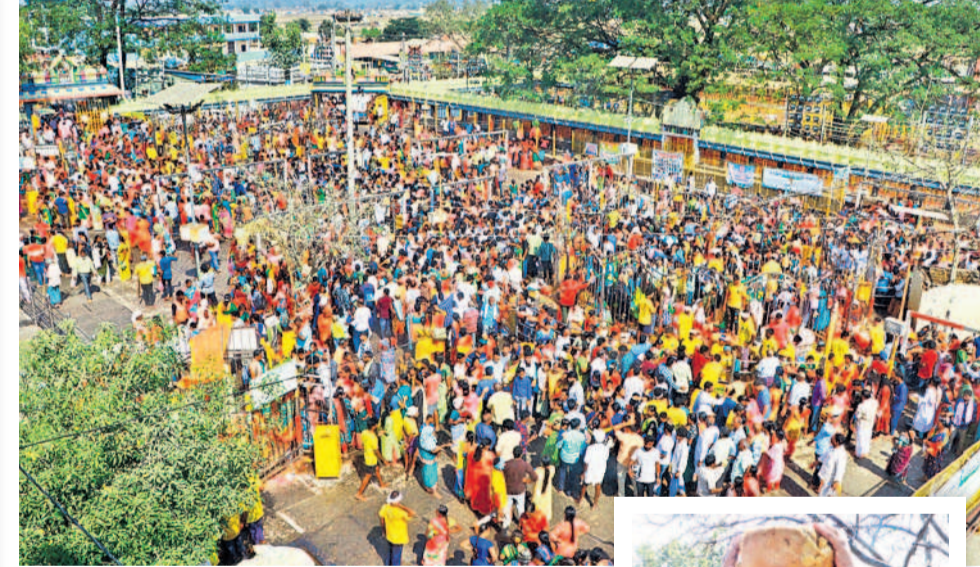
అమ్మవారి గద్దెల వద్ద భక్తుల కోరికలూ