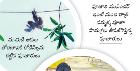
మామిడి ఆకుల తోరణాన్ని కోడిపిల్లను కట్టిన పూజారులు