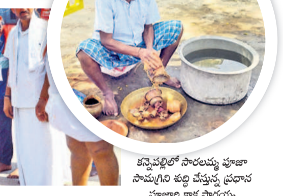
కన్నెపల్లిలో సారలమ్మ పూజా సామగ్రిని శుద్ధి చేస్తున్న ప్రధాన పూజారి కాక సారయ్య