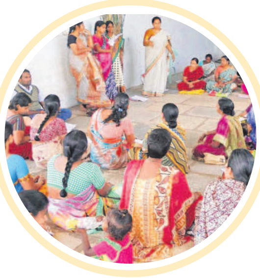
జిల్లాలోని ప్రాధాన్యత, ప్రాధాన్యత రంగాలకు రుణాలు అందించేందుకు జిల్లా లీడ్ బ్యాంక్ అధ్యక్షులలో ప్రతి సంవత్సరం ప్రణాళిక తయారవుతుంది. వార్షిక రుణ ప్రణాళిక ఆధారంగా ఆయా రంగాలకు బ్యాంకులు రుణాలను మంజూరు చేస్తాయి. ఈ ఏడాది గతానికి భిన్నంగా రెండు మార్లు రంగాల మినహా ప్రణాళిక లక్ష్యానికి మించి రుణాలను బ్యాంకులు మంజూరు చేశాయి.

గ్రామీణాభివృద్ధి శాఖ అధ్యక్షులలో కొనసాగుతున్న స్వయం సహాయక మహిళా సంఘాలకు 70,992.77 లక్షల రుణ లక్ష్యానికిగాను డిసెంబర్ నాటికి 68,969.87 (97.15 శాతం) కోట్ల రుణాలను పంపిణీ చేశారు. మెట్టా అధ్యక్షులలోని సంఘాలకు 9,834.63 లక్షల రుణాలను ఇవ్వాలని సంకల్పించి ఇప్పటి వరకు రూ.9,037.57 (91.90 శాతం) లక్షల రుణాలను బ్యాంకులు అందజేశాయి.