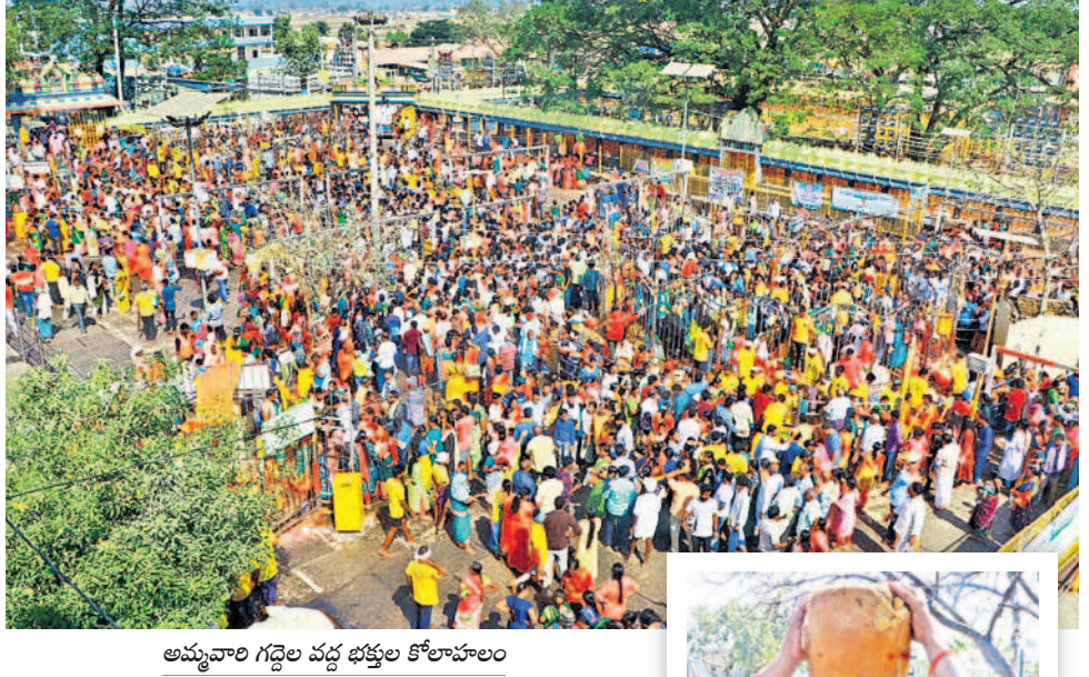
అమ్మవారి గద్దెల వద్ద భక్తుల కొలహాలం