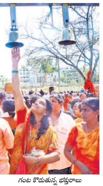
గుంట కొడుతున్న భక్తురాలు