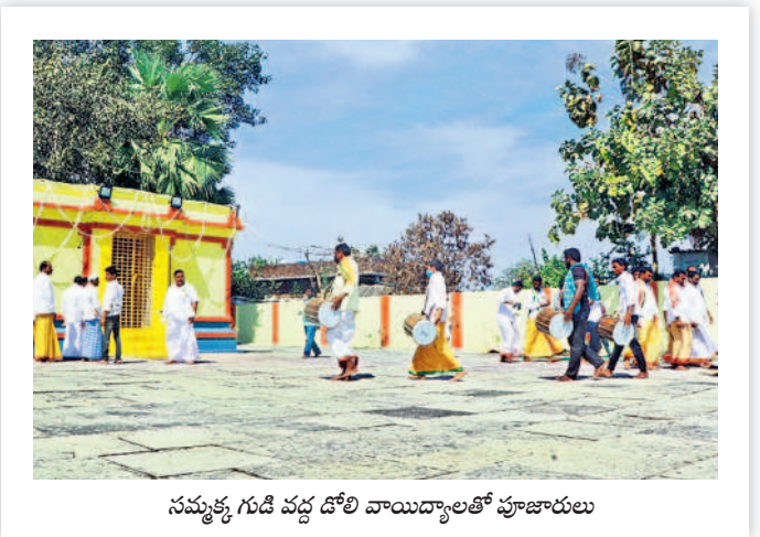
నమ్మక్క గుడి వద్ద దోలి వాయిద్యాలతో పూజారులు