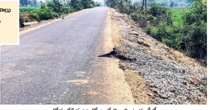
రోడ్డు వేసిన 20 రోజులే దెబ్బతింటున్న బీటీ