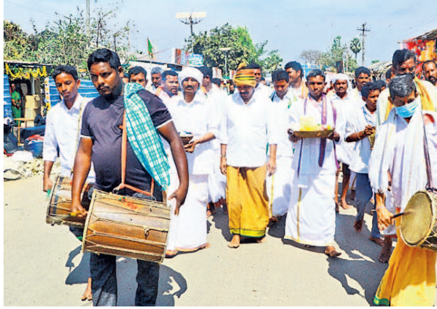
నమ్మక్క గుడి వద్దకు దోలి వాయిద్యాలతో వస్తున్న పూజారులు