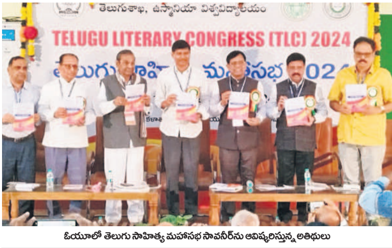
ఓయూలో తెలుగు సాహిత్య మహాసభ సావనీర్ ను ఆవిష్కరిస్తున్న అధ్యక్షులు