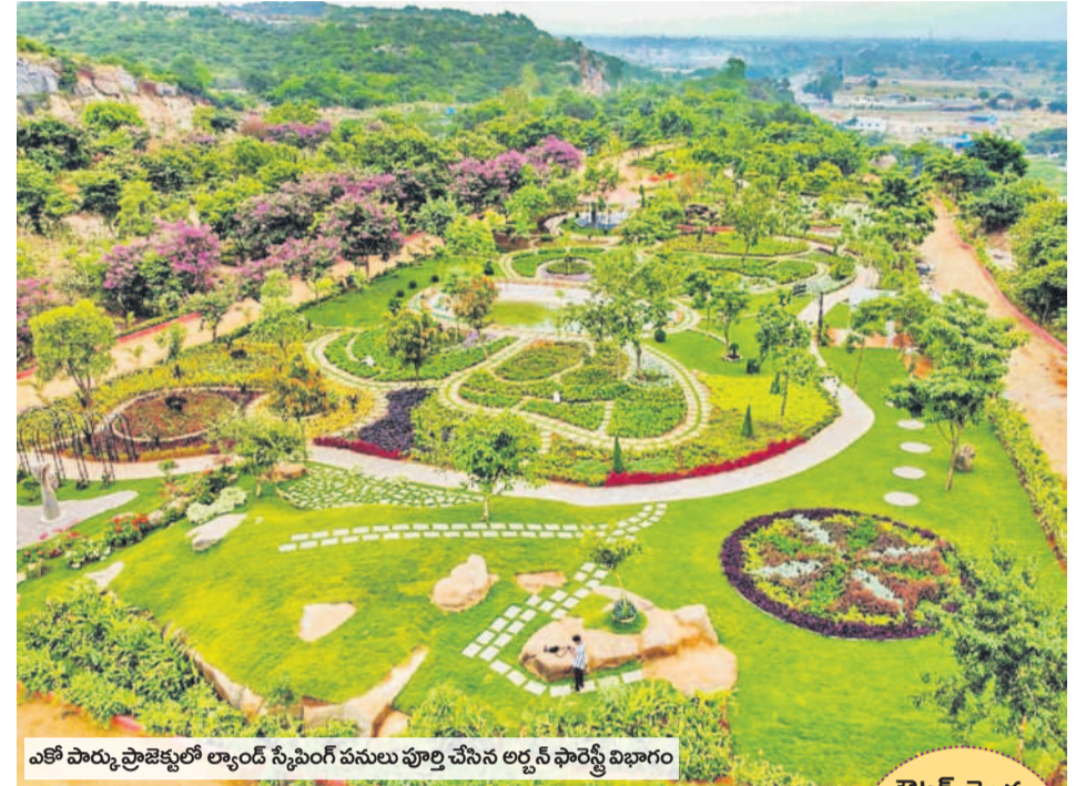
ఎకో పార్కు ప్రాజెక్టులో ల్యాండ్ సేషింగ్ పనులు పూర్తి చేసిన అర్జన్ ఫార్వేర్ట్ విభాగం