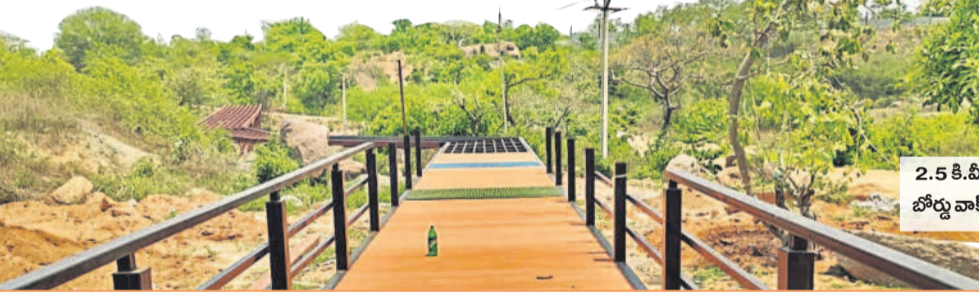
2.5 కి.మీ బోర్డు వాక్