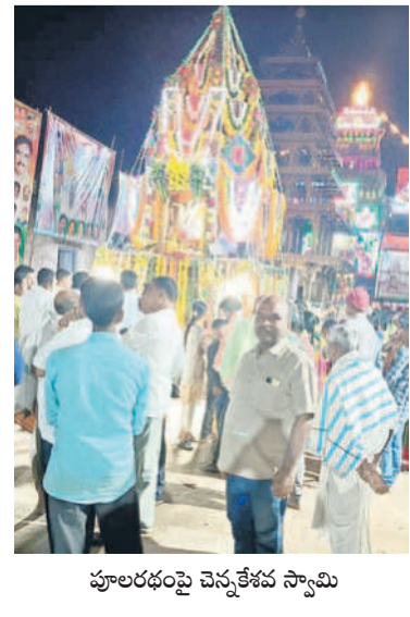
పూలతేరుపై చెన్నకేశవ స్వామి