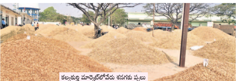
కల్వర్తి మార్కెట్లో వేరు శనగకు పులు