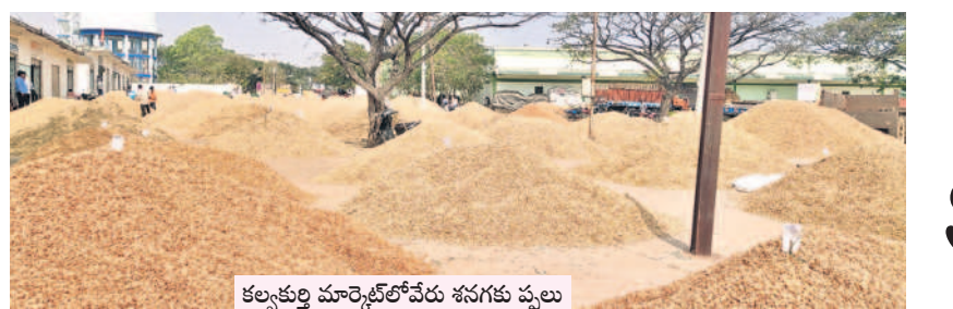
కల్వర్తి మార్కెట్లో వేరు శనగకు ప్పలు

హట్ న్యాట్లు ఇవే.. ఎన్ హెచ్-44 వెంట ఉన్న బాలాసగర్, రాజాపూర్, జడ్పర్, భూతూర్, మూసాపేట, అడ్డంకు, కొత్తకోట, పెళ్ళేరు, మానవ పాడు, అలంపూర్ ప్రాంతాల్లోని దాఖలు, పాన్ డబ్బాలో గంజాయి విక్రయిస్తున్నారు. నల్లమలలోని పలు గ్రామాల్లో మత్తు పంటను సాగు చేసి అక్కడి నుంచి గుట్టుపప్పుడు కాకుండా రవాణా చేస్తున్నారు. పాలమూరులోని రామయ్యపేటి, ఏనుగండ, బోయపల్లి, మోతినగర్, కొత్త చెరువు రోడ్, గంజ్, పాపాపేటగడ్డ, ప్రేమనగర్, రైల్వే స్టేషన్, ఆర్టీసీ బస్టాండ్, జడ్పర్లోని నిమ్మూరువిగడ్డ, సిగ్నల్ గడ్డ, రైల్వే స్టేషన్, పోలవర సెక్ ప్రాంతాల్లో విక్రయాలు జోరుగా సాగుతున్నట్లు తెలిసింది. కోస్కి, నారాయణపేట మత్తల్, వనపర్తి, గద్వాల, నాగర్ కర్నూల్, కల్వర్తి, కొల్లూర్, అచ్చంపేట, బల్లూరు, లింగాల ప్రాంతాల్లో దండా మూడు పువ్వులు ఆరు కాయలుగా సాగుతున్నట్లు సమాచారం. పోలీసులు, ఎస్టాబ్లిష్ మెంట్ అధికారులు చర్యలు తీసుకోవాలి అంటూ వ్యాపారం జోరందుకున్నట్లు ఆరోపణలు ఉన్నాయి.