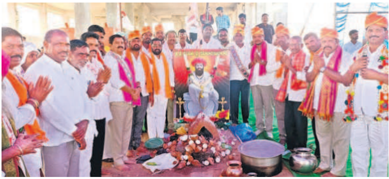
ఊరంచుండంలో పూజలు చేస్తున్న ఎంపీ మన్నె శ్రీనివాస్ రెడ్డి