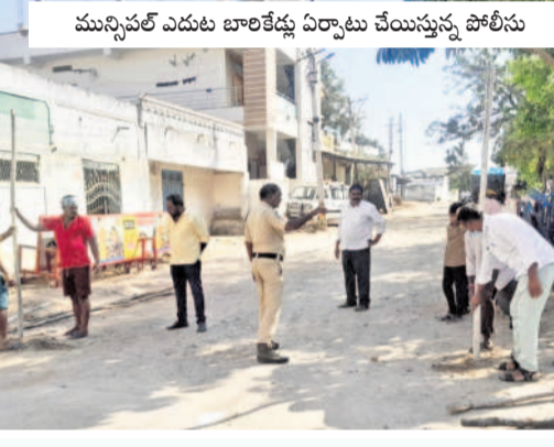
మున్సిపల్ ఎదుట బాలకెట్టు ఏర్పాటు చేయిస్తున్న పోలీసులు

దీంతో ఇబ్రహీంపట్నం చైర్మన్లపై పెట్టిన అవిశ్వాస తీర్మానం నెగ్గడం..? వీగిపోతూండా అనేది శుభవారం తేలవచ్చును.