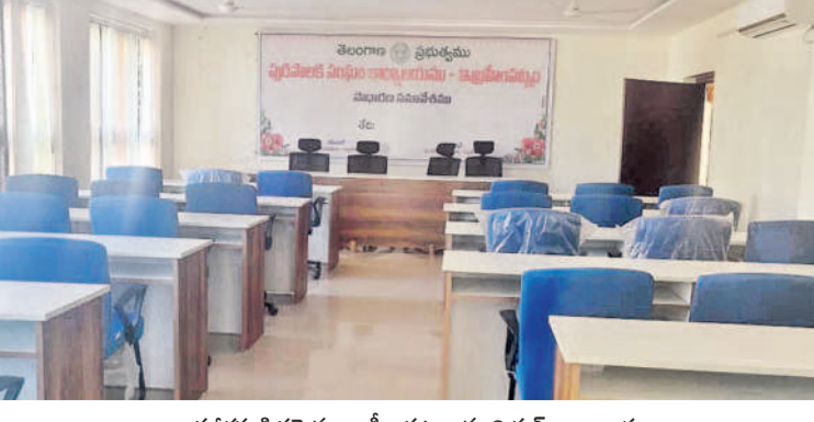
బలపరీక్షకు సిద్ధమైన ఇబ్రహీంపట్నం మున్సిపల్ కార్యాలయం

వికారాబాద్ మండలానికి 33 సీసీ రోడ్ల నిర్మాణం కోసం రూ.3 కోట్లు, దారురులో 48 సీసీ రోడ్లకు రూ.2.5 కోట్లు, మోమినపేటలో 41సీసీ రోడ్లకు రూ.3 కోట్లు, ముర్తల్లో 30 సీసీ రోడ్లకు రూ.2.63 కోట్లు, బంబూరులో 30 సీసీ రోడ్లకు రూ.2.85 కోట్లు, కోట్పల్లిలో 24 సీసీ రోడ్లకు రూ.2 కోట్లు, పరిగిలో సీసీ 46 రోడ్లకు రూ.2.20 కోట్లు, పూడూరులో 51 సీసీ రోడ్లకు రూ.2.50 కోట్లు, డోమలో 52 సీసీ రోడ్లకు రూ.2.53 కోట్లు, కులకచర్లలో 44 సీసీ రోడ్లకు రూ.2.09 కోట్లు, చౌదాపూర్లో 16 సీసీ రోడ్లకు రూ.7.3 కోట్లు, తాండూరులో 52 సీసీ రోడ్లకు రూ.3 కోట్లు, పెద్దేమలలో 53 సీసీ రోడ్లకు రూ.కోటి, యాలాలలో 57 సీసీ రోడ్లకు రూ.3 కోట్లు, జుమ్రాబాద్లో 46 సీసీ రోడ్లకు రూ.3 కోట్లు, బొంబాయిపేటలో 55 సీసీ రోడ్లకు రూ.7.20 కోట్లు, దౌలాబాద్లో 36 సీసీ రోడ్లకు రూ.6.05 కోట్లు, కొండగల్ మండలంలో 37 సీసీ రోడ్ల నిర్మాణానికి రూ.6.75 కోట్లు మంజూరయ్యాయి.