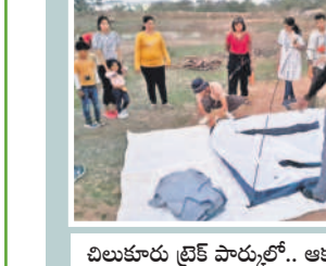
చిలుకూరు ట్రైక్ పార్కులో.. ఆకట్టుకుంటున్న గ్రీనబిల్డ్, కొండలు, వాకింగ్ ట్రాక్...