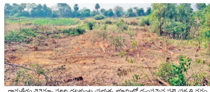
రామచంద్రం రెవెన్యూ పరిధి దట్టమంట ప్రభుత్వ భూమిలో ధ్వంసమైన పల్లె ప్రకృతి వనం

హరితహారం మొక్కలు, పల్లె ప్రకృతి వనాల్లో మొక్కల సంరక్షణ కోసం కేసీఆర్ ప్రభుత్వం జీవీలకు ట్రాక్టర్లతో పాటు ట్యాంకర్లను సమకూర్చింది. సీట్ల పట్టించుకుంటున్న డ్రైవర్లను సైతం నియమించింది. నేడు ఆ పనులే జరిగినట్లు కనిపించడం లేదు. ములుగు జిల్లా కేంద్రం నుంచి గట్టమర్తి మొదలుకొని జంగాలపల్లి వరకు జాతీయ రహదారికి ఇరువైపులా చాలా వరకు మొక్కలు ఎండిపోగా, పదుల సంఖ్యలో కొనుగోళ్ల రిపో ఉన్నాయి.