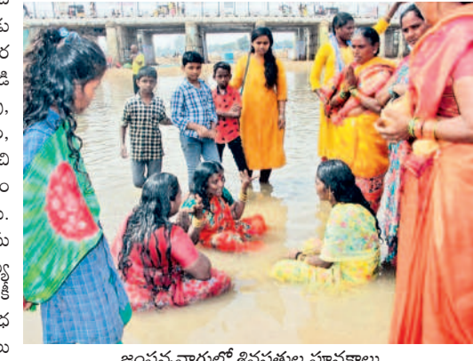
జంపన్నవారి గుల్లో శివసత్తుల పూజనకాలు

తాడ్యాయి, ఫిబ్రవరి 15 : వనదేవతల సమ్మక్క - సారలమ్మకు భక్తులు నీరాజనాలు పలుకుతున్నారు. గంటల తరబడి లైట్లలో నిల్చుని అమ్మవార్లను దర్శించుకుంటున్నారు. గురువారం వివిధ ప్రాంతాల నుంచి భక్తులు వైవేట్, ఆర్డీసీ బస్సుల్లో మేడారానికి చేరుకున్నారు. జంపన్నవారి గుల్లో పుణ్య స్నానాలు ఆచరించిన అనంతరం వారు ఒడ్డున గల నాగులమ్మ, జంపన్న గద్దెలకు ప్రత్యేక పూజలు నిర్వహించి సంతాన ముడుపులు కడుతున్నారు. సమ్మక్క - సారలమ్మ, గోవిందరాజు, పగడి ధర్మరాజు గద్దెలపై పసుపు, కుంకుమ, ఎత్తుబెల్లం, నూతన వస్త్రాలు సమర్పించి గిరిజన సంప్రదాయం ప్రకారం పూజలు చేశారు. రోజంతా దర్శనాలు చేసుకుంటున్న భక్తుల సంఖ్య ఎక్కువగానే ఉన్నప్పటికీ రాత్రి వేళలో కూడా వివిధ ప్రాంతాల నుంచి భక్తులు