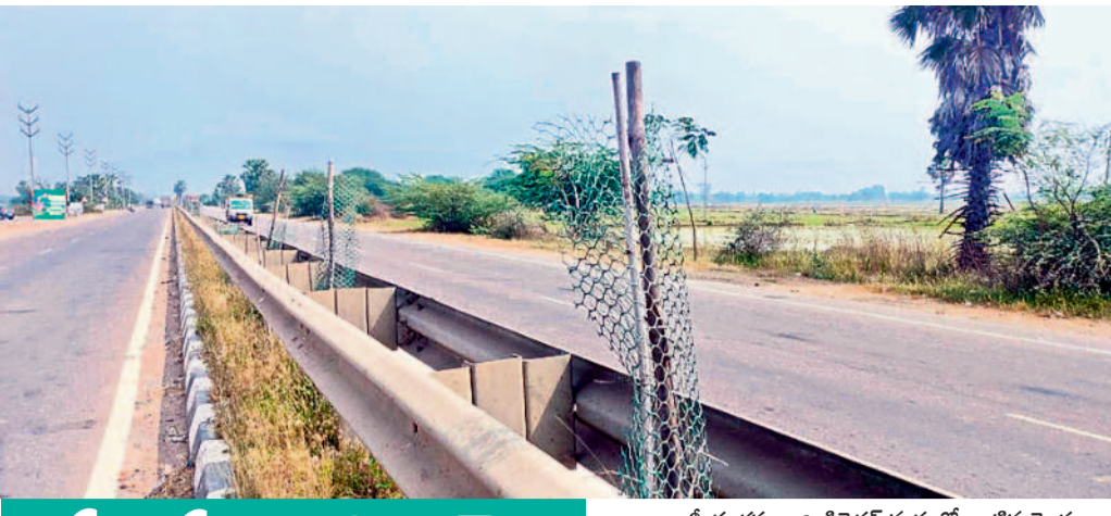
పచ్చదనంపై జాతీయ రహదారి డివైడర్ మధ్యలో నాటిన మొక్కలు ఎండిపోగా, భారీగా కచ్చిస్తున్న డ్రై గార్డులు, కర్రలు