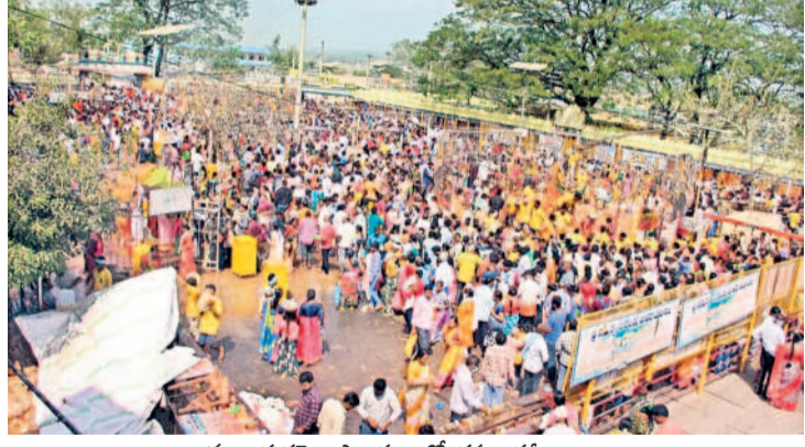
అమ్మవార్ల గద్దెల ప్రాంగణంలో భక్తుల గద్దె

పల్లె ప్రకృతి వనాల్లో మొక్కల సంరక్షణ కోసం కేసీఆర్ ప్రభుత్వం జీవీలకు ట్రాక్టర్లతో పాటు ట్యాంకర్లను సమకూర్చింది. సీట్ల పట్టించుకుంటున్న డ్రైవర్లను సైతం నియమించింది. నేడు ఆ పనులే జరిగినట్లు కనిపించడం లేదు. ములుగు జిల్లా కేంద్రం నుంచి గట్టమర్తి మొదలుకొని జంగాలపల్లి వరకు జాతీయ రహదారికి ఇరువైపులా చాలా వరకు మొక్కలు ఎండిపోగా, పదుల సంఖ్యలో కొనుగోళ్ల రిపో ఉన్నాయి.