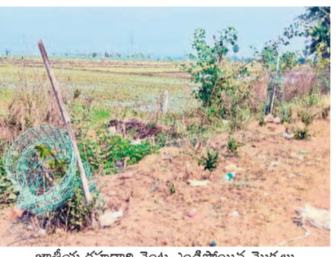
జాతీయ రహదారి వెంట ఎండిపోయిన మొక్కలు

జాతీయ రహదారి వెంట బోసిపోతున్న ట్రీ గార్డులు, కర్రలు పల్లె ప్రకృతి వనాల వైపు కన్నెత్తి చూడని అధికారులు మొక్కల సంరక్షణను మరిచిన జీవీ సిబ్బంది పట్టణాలు, గ్రామాల్లో పచ్చదనం కొరవడుతోంది. రహదారులపై హరితహారం మొక్కలు ఆన వాళ్లు లేకుండా పోతున్నాయి. పల్లె ప్రకృతి వనాల వైపు అధికారులు కన్నెత్తి చూడకపోవడంతో మొక్కలు ఎండిపోయి పొదలు కళా విహారంగా కనిపిస్తున్నాయి. పంచాయతీ సిబ్బంది సైతం మొక్కల సంరక్షణను గాలి కొలిచిలేశారు. ములుగు జిల్లా కేంద్రంలోని జాతీయ రహదారికి ఇరువైపులా నాటిన మొక్కలు ఎండిపోయి ట్రీ గార్డులు, కర్రలు మాత్రమే మిగిలాయి. మండలంలోని పల్లె ప్రకృతి వనాల్లో గిరందక మొక్కలు ఎండిపోతున్నా అధికారులు, పంచాయతీ సిబ్బంది పట్టించుకోకపోవడంపై విమర్శలు వెల్లువెత్తుతున్నాయి.