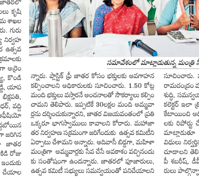
సమావేశంలో మాట్లాడుతున్న మంత్రి సీతక్క

పారిశుధ్య పనులు ముమ్మరం చేయాలి 1.50 కోట్ల మంది భక్తులకు సౌకర్యాలు రాష్ట్ర పంచాయతీరాజ్ శాఖ మంత్రి సీతక్క కొలుపుదీరిన మహాజాతర ఉత్సవ కమిటీ ఘనంగా ప్రమాణ స్వీకారోత్సవం