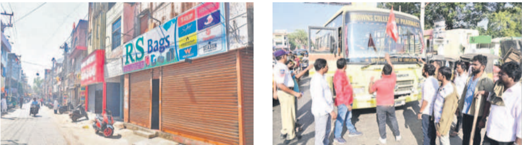
ఖమ్మం నగరంలో మాతపదిన పాపులు