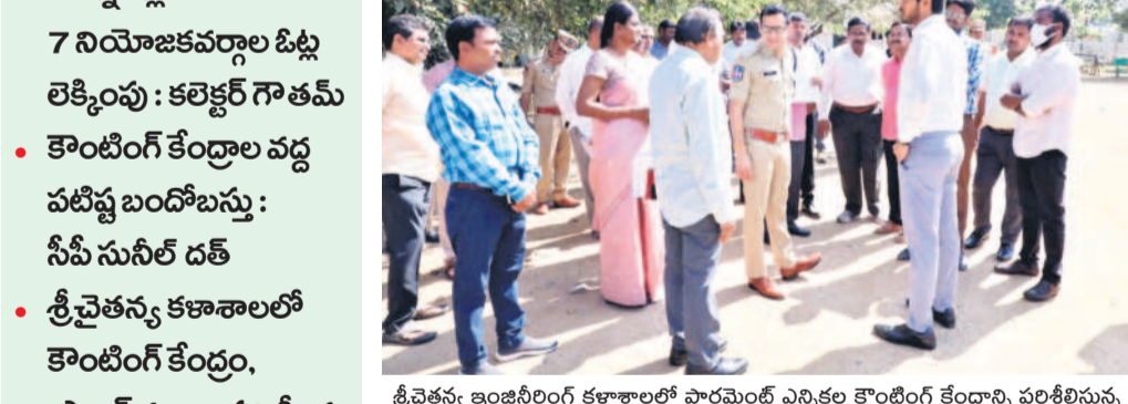
శ్రీచైతన్య ఇంజనీరింగ్ కళాశాలలో కౌంటింగ్ ఎన్నికల కౌంటింగ్ కేంద్రాన్ని పరిశీలిస్తున్న కలెక్టర్ వీవీ గౌతమ్, సీపీ సునీల్ దత్, అధికారులు

కూసుమంచి (ఖమ్మం రూరల్), ఫిబ్రవరి 16 : పార్లమెంట్ ఎన్నికల నిర్వహణ, ఓట్ల లెక్కింపు ప్రక్రియ కోసం అధికారులు పకడ్బందీ ఏర్పాటు చేయాలని, ఎన్నికల నిబంధనలకు లోబడి అధికారులు సమర్థంగా విధులు నిర్వర్తించాలని కలెక్టర్ వీవీ గౌతమ్ అన్నారు. రూరల్ మండలం పాన్సె కల్లులోని శ్రీచైతన్య ఇంజనీరింగ్ కళాశాలలో ఏర్పాటు చేసిన కౌంటింగ్ కేంద్రంలోని జిల్లాలోని ఏడు అసెంబ్లీ నియోజకవర్గాల ఈవీఎంలు, పోస్టల్ బ్యాలెట్లను లెక్కించాలని నిర్ణయించిన కలెక్టర్, సీపీ సునీల్ దత్, ఇతర అధికారులతో కలిసి శుభ్రవారం కళాశాలను సందర్శించారు. ఈ సందర్భంగా నిర్వహించిన సమీక్షలో కలెక్టర్ మాట్లాడుతూ స్ట్రాంగ్ రూం, రిస్క్ కేంద్రాల ఏర్పాటు, భద్రత, పాస్కోర్, తాగునీటి సౌకర్యంతోపాటు పోస్టల్ బ్యాలెట్లకు ప్రత్యేక గదులు సిద్ధం చేయాలన్నారు. పోలింగ్ నిర్వహణ, రిస్క్స్ బ్యాలెట్లను నిర్వహించే సిబ్బందికి మండలాల్లో ఎంపీడీవోలు, ఎన్నికల బాధ్యులు తరచూ ఇవ్వాలన్నారు. ఒక గదిలో ఏడు నియోజకవర్గాలకు సంబంధించిన ఈవీఎంలను భద్రపరచాలన్నారు. పోలింగ్ హృదయన తర్వాత బ్యాలెట్లు, ఈవీఎంలను సీఆర్ఎస్ఎఫ్ రక్షణతో కౌంటింగ్ కేంద్రానికి తరలించాలన్నారు. ప్రతి పోలింగ్ కేంద్రం చరిధిలో సీసీ