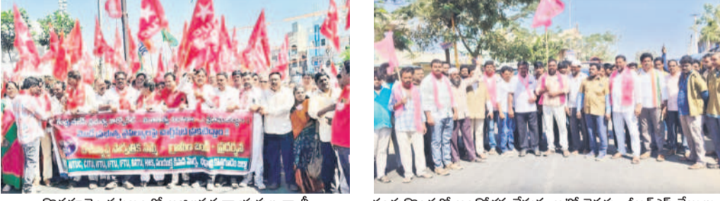
కొత్తగూడెం పట్టణంలో అఖిలపక్ష నాయకుల రాష్ట్రీ