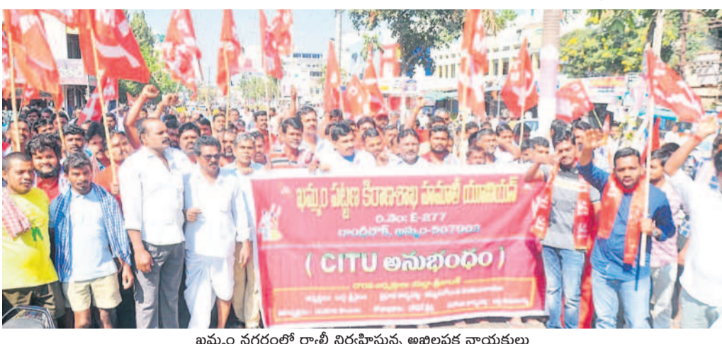
ఖమ్మం నగరంలో రాష్ట్ర నిర్వహిస్తున్న అఖిలపక్ష నాయకులు

ఖమ్మం, ఫిబ్రవరి 16 (నమస్తే తెలంగాణ ప్రతినిధి): కేంద్రంలోని బీజేపీ ప్రభుత్వం ఆపలంబిస్తున్న కార్మిక వ్యతిరేక విధానాలను నిరసనగా అఖిల పక్షాలు, కార్మిక, ప్రజాసంఘాలు ఇచ్చిన పిలుపు మేరకు శుభ్రవారం ఉమ్మడి ఖమ్మం జిల్లాలో గ్రామీణ ఖాంతీ బండ్ల విజయవంతమైంది. వామపక్షవాదులు, ప్రజాసంఘాల నాయకులు, వివిధ రాజకీయ పార్టీల కార్యకర్తలు రోడ్ల మీదకు వచ్చి బీజేపీ ప్రభుత్వ వైఖరికి నిరసనగా ప్రదర్శనలు, రాస్తాకోల నిర్వహించారు. తెలంగాణజామీన్ పట్టణాల్లోని బస్ డిపోల వద్దకు వెళ్లి బస్సులు బయటకు రాకుండా అడ్డుకున్నారు. బండ్ల పిలుపును అందుకుని వ్యాపార వాణిజ్య సంస్థలు, వెల్డర్ల బండ్లు, విద్యార్థులు, వ్యాపారులు, సినిమా థియేటర్ల యజమాన్యాలు స్వచ్ఛందంగా వాటిని మూసివేశాయి. ఆరో డైవర్ల యూని యస్సు, వివిధ రంగాల్లో పనిచేస్తున్న కార్మికులు సమ్మెలో పాల్గొన్నారు. బండ్ల కారణంగా బ్యాంకుల్లో లావాదేవీలు నిలిచిపోయాయి. రాస్తాకోల కేల కారణంగా ఎక్కడిక్కడ వాహనాలు నిలిచిపోయాయి. దీంతో ప్రజా రవాణా తీవ్ర అంతరాలు ఏర్పడింది. ప్రజలు ప్రత్యామ్నాయ మార్గాల ద్వారా గమ్యస్థానాలకు చేరుకున్నారు. కొత్తగూడెంలో అఖిల