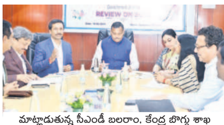
మాట్లాడుతున్న సీఎంఐ బలరాం, కేంద్ర బొగ్గ శాఖ కార్యదర్శి అప్రతికారల్ మీనా

బొగ్గ ఉత్పత్తి, రవాణాలో సింగరేణి సంస్థ పనితీరు భేష కేంద్ర బొగ్గ శాఖ కార్యదర్శి అప్రతికారల్ మీనా