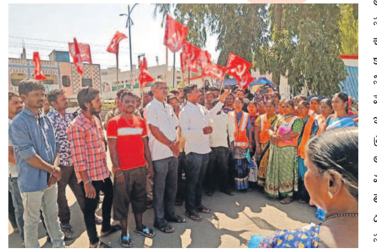
మెదక్ జిల్లా కేంద్రంలో సమ్మెలో భాగంగా మాట్లాడుతున్న సీబీఎస్సీ నాయకులు

కేంద్ర, రాష్ట్ర ప్రభుత్వ విధానాలకు వ్యతిరేకంగా ఆందోళన ఉమ్మడి మెదక్ జిల్లా వ్యాప్తంగా ధర్మాలు, రాష్ట్రాధికార ఆలోచన బందీ విజయవంతం