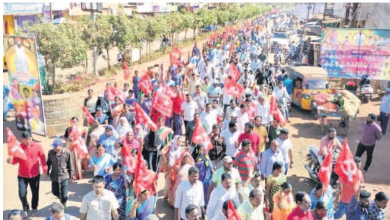
జహీరాబాద్ పట్టణంలో కార్మిక, రైతు, ప్రజా వ్యతిరేక విధానాలకు వ్యతిరేకంగా రా్యలీ నిర్యహిస్తున్న కార్మికులు