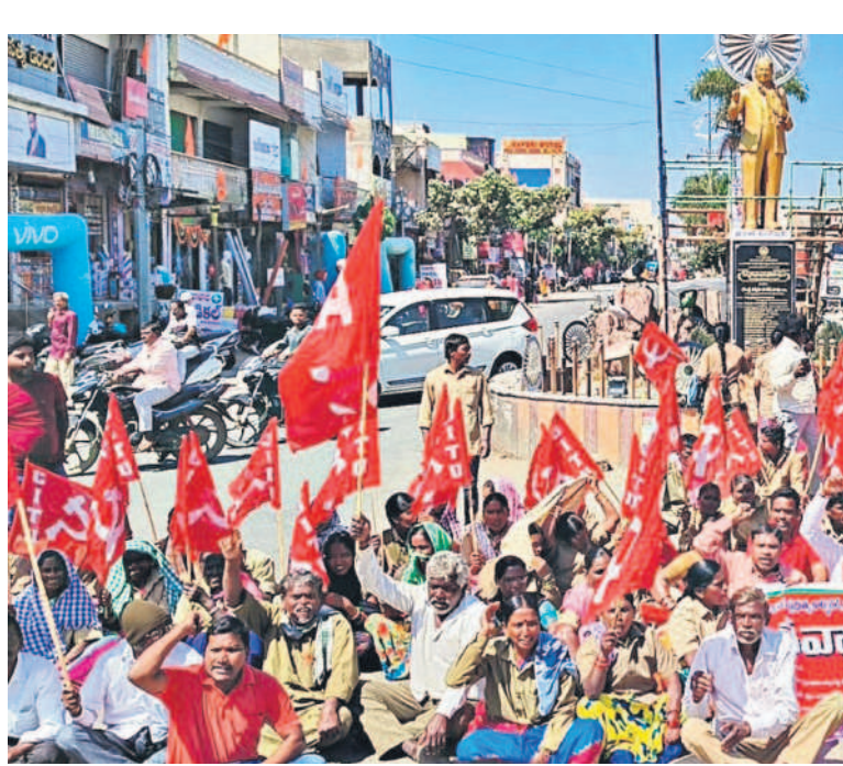
సిద్దిపేట జిల్లా గజ్వేలలోని లంబోర్నీ చారస్తాలో ధర్మా చేస్తున్న కార్మికులు