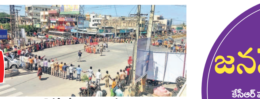
నర్సాపూర్లో సీబీఎస్సీ ఆధ్వర్యంలో మానవహారం

7 హైదరాబాద్, శనివారం 17 ఫిబ్రవరి 2024 MEDAK